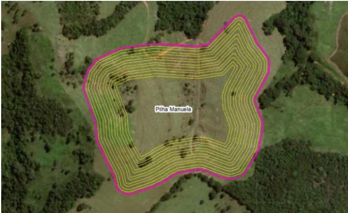
Figura 4 - Pilha Manuela

A nova pilha de estéril a ser implantada sobre um talvegue, denominada “Manuela”, terá uma área de 14,25 ha , como mostra a figura a seguir.