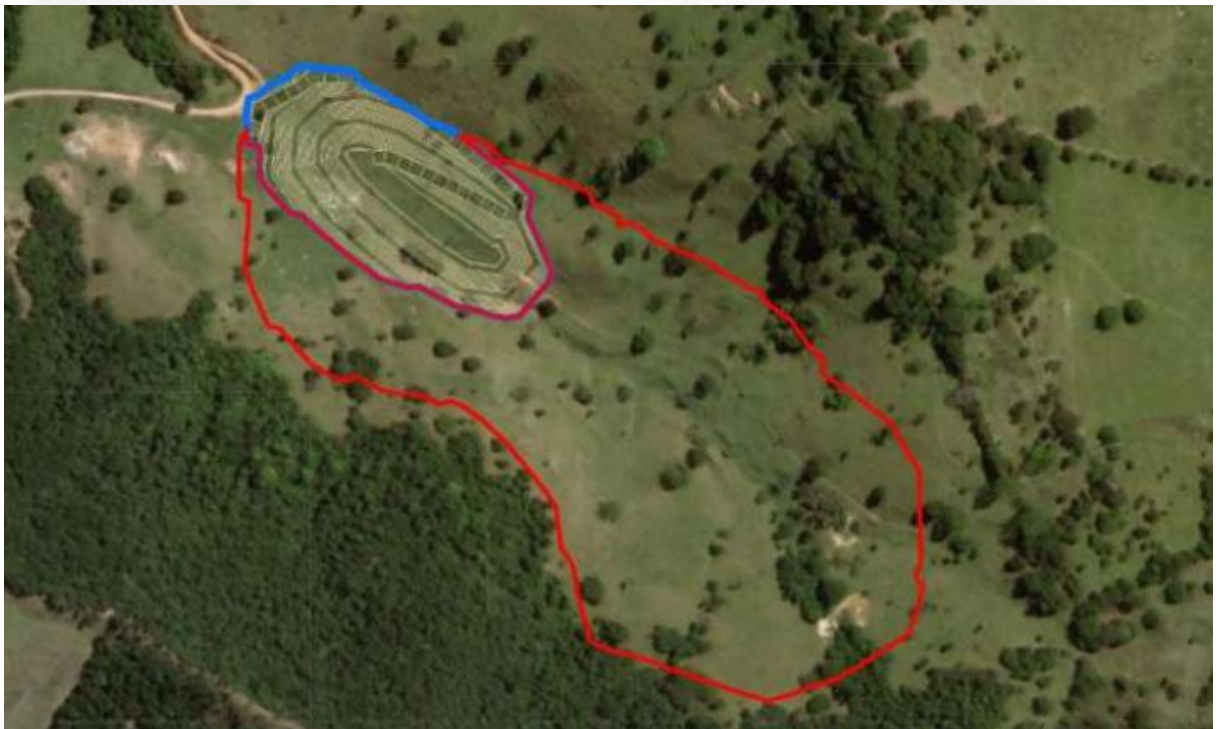
Figura 3 - Ampliação da pilha Belém

A pilha de estéril existente, denominada “Belém”, passará dos atuais 3 ha para 12,31 ha , como mostra a figura a seguir.