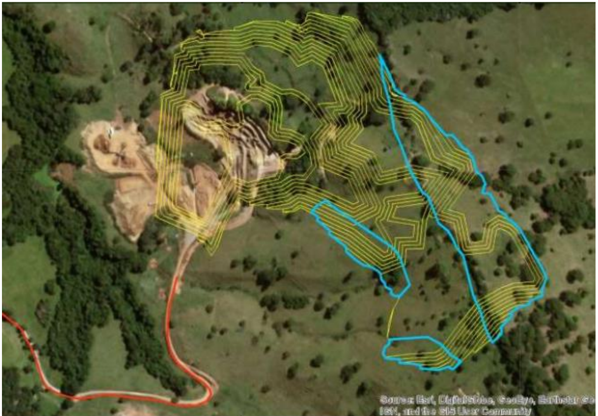
Figura 2 - Área de ampliação da cava

A pilha de estéril existente, denominada “Belém”, passará dos atuais 3 ha para 12,31 ha , como mostra a figura a seguir.