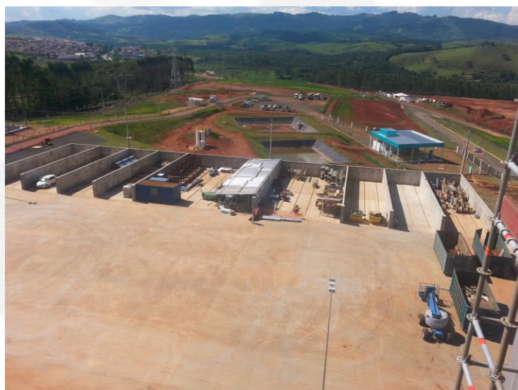
VISÃO GERAL: BAIAS, LAGOAS E ETE