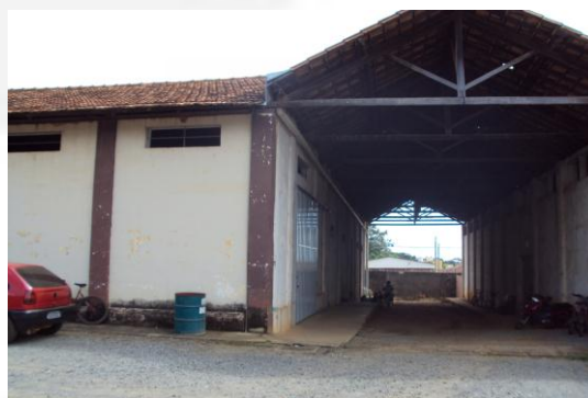
- Acesso a indústria.