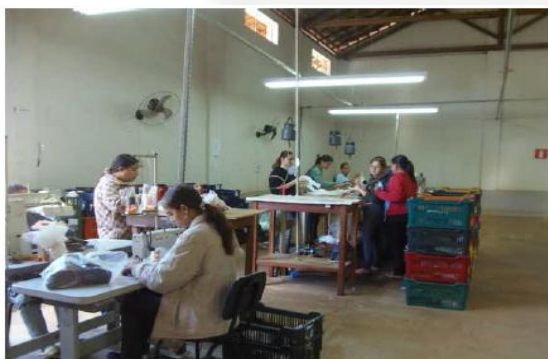
- Montagem da língua