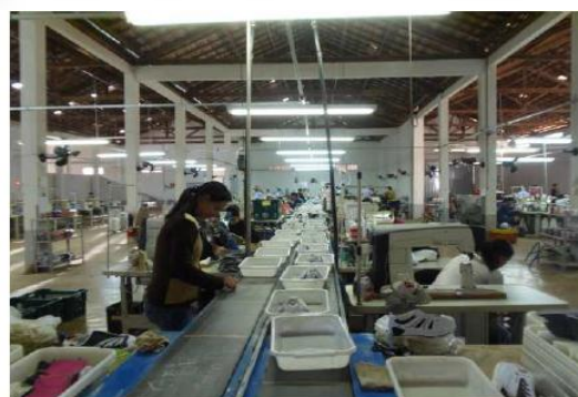
- Montagem do cabedal.