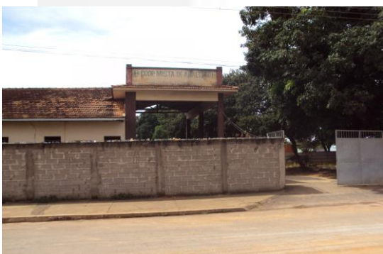
- Vista área externa.