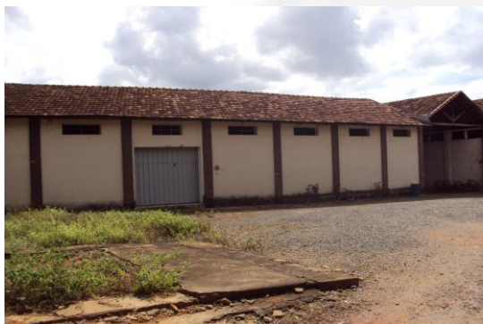
- Vista da indústria.

Empreendedor: Abaeté Manufaturados de Calçados Ltda. ME. Empreendimento: Abaeté Manufaturados de Calçados Ltda. ME. CNPJ: 08.594.724/0001-12 Municípios: Abaeté/MG Atividade(s): Fabricação de Calçados em Geral. Código(s) DN 74/04: C-09-03-2 Processo: 18817/2012/001/2012. Validade: 06 anos