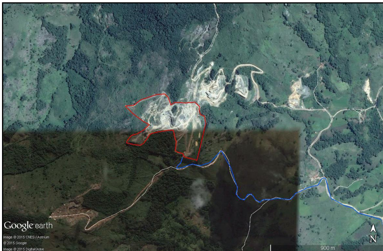
Figura 02 – Localização e acesso ao empreendimento. Em vermelho empreendimento Juparaná. Em azul acesso ao empreendimento.