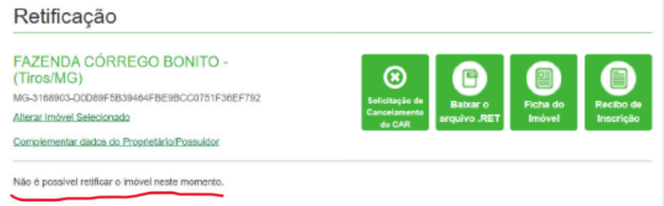
Figura 1: Situação do Imóvel no SICAR

Portanto as informações contidas no CAR atualmente não condizem com a realidade do Empreendimento , informa-se que assim que terminar o período de Análise será retificado o referido CAR