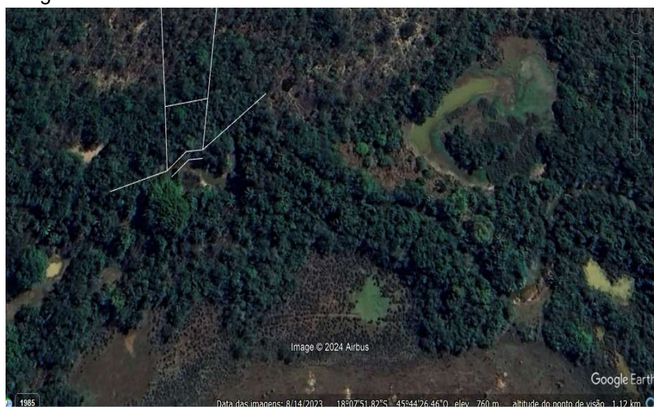
Imagem com APP Beira do Rio