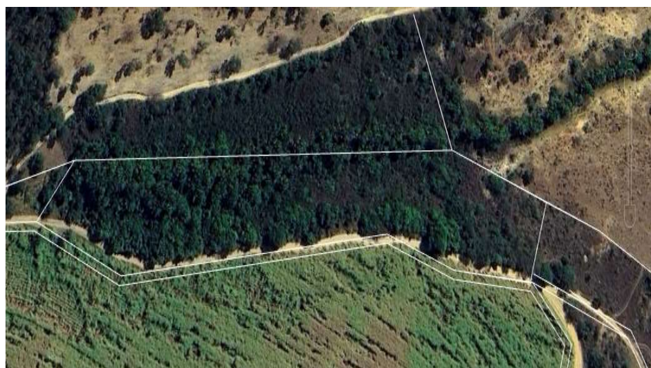
Imagem com APP Vereda