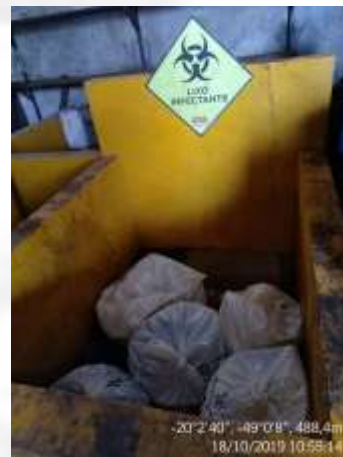
Figura 7. Depósito de resíduos sólidos