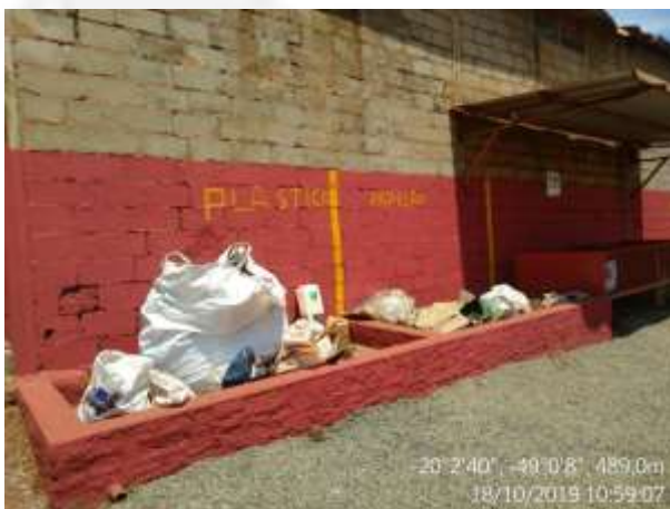
Figura 8. Depósito de resíduos sólidos