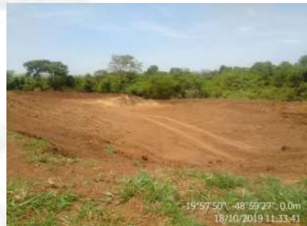
Figura 17. Área de disposição dos animais mortos.