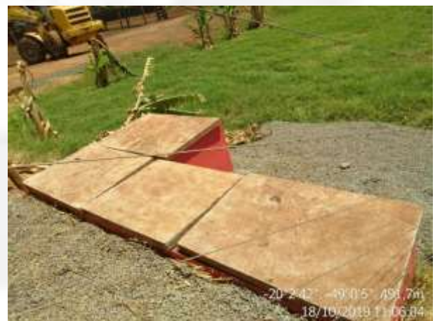
Figura 9. Caixa separadora de água e óleo