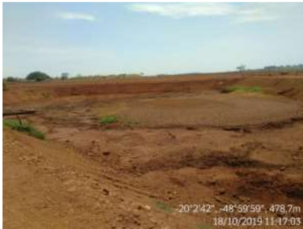
Figura 15a. Barramento vazio