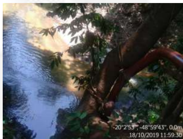
Figura 3b. Ponto de captação de água