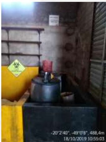
Figura 6. Depósito de resíduos sólidos