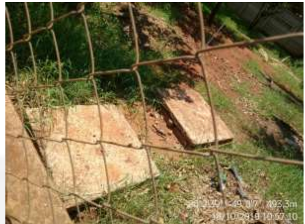
Figura 5. Fossa séptica