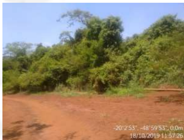
Figura 13. Área de preservação permanente