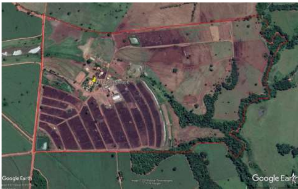
Figura 1. Vista aérea da propriedade (área aproximada).

A área total do empreendimento é de 87,6040 ha (área na matrícula) e de 90,5269 ha (área do georreferenciamento). O uso e a ocupação do solo ocorrem conforme demonstrado na Tabela 1.