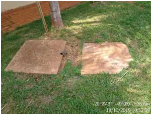
Figura 4. Fossa séptica