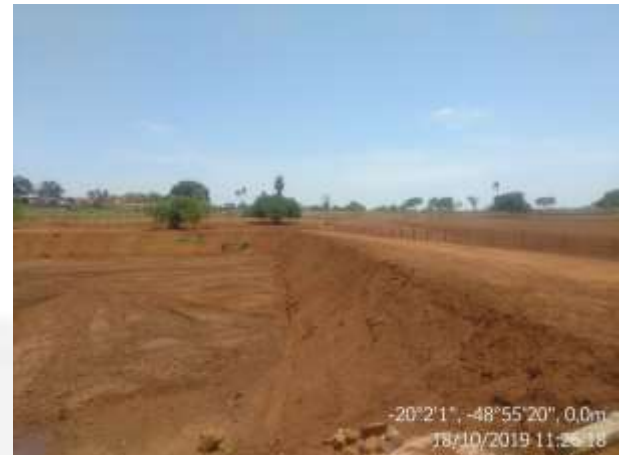
Figura 15b. Entorno do barramento