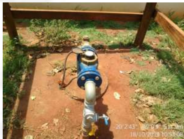
Figura 2. Ponto de captação de água