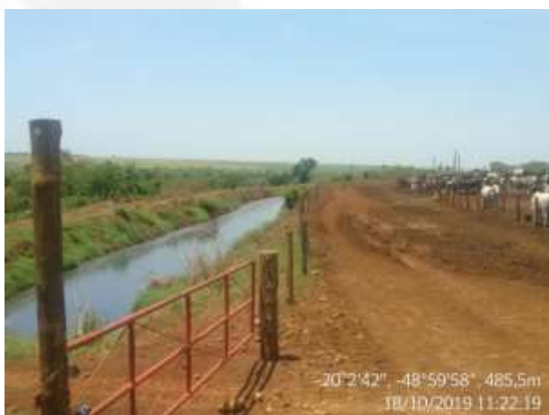
Figura 14a. Lagoa de retenção