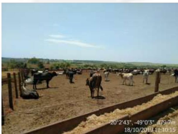
Figura 12. Curral de confinamento