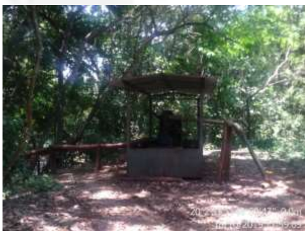
Figura 3a. Ponto de captação de água