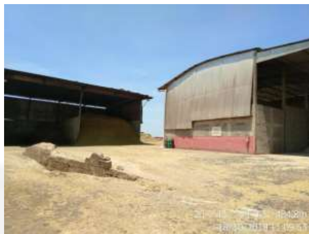
Figura 11. Galpões de armazenamento e preparo de ração