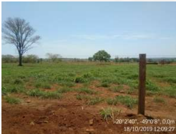
Figura 16. Área de disposição dos dejetos do confinamento (vazio)