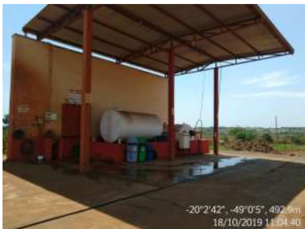
Figura 10. Ponto de abastecimento