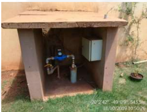
Figura 1. Ponto de captação de água