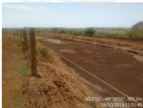
Figura 14b. Lagoa de retenção