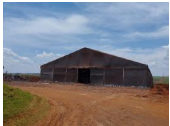
Foto 04. Novo galpão