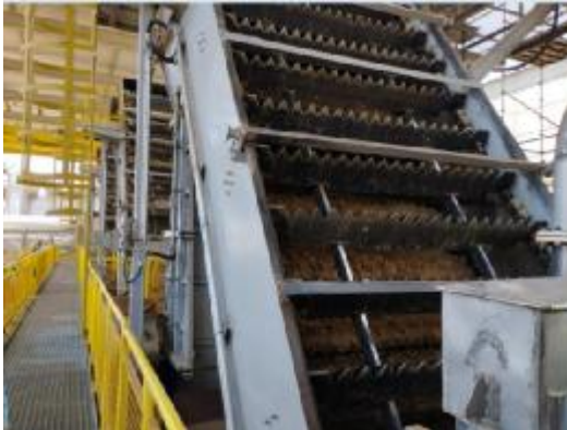
Foto 01. Novos ternos de moenda em operação