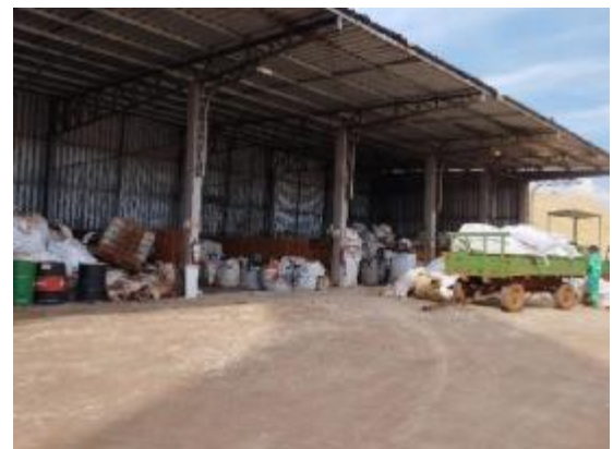
Foto 04. Central de resíduos