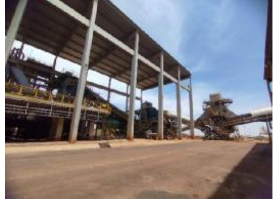
Foto 02- Nova linha de moenda.