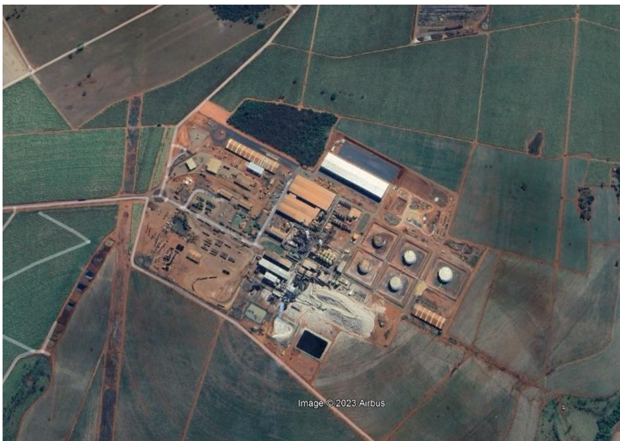
Figura1- Localização do empreendimento USINA CERRADÃO LTDA.

O empreendimento dispõe de setor de moagem, fábrica de açúcar, destilação de álcool, duas caldeiras, geradores para produção de energia, Estação de Tratamento de Esgoto, Estação de Tratamento de Água; Pátio de armazenamento de sucatas; Posto de combustíveis; Oficina de manutenção de veículos, maquinários e manutenção industrial.