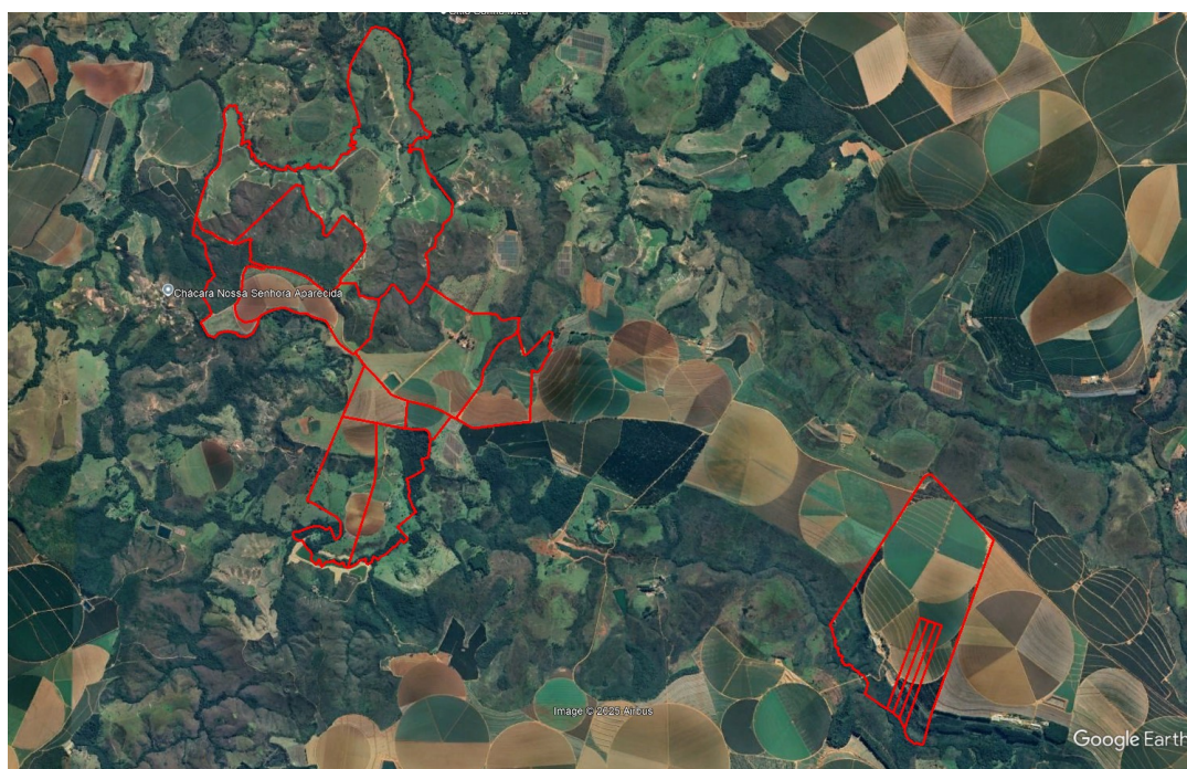
Imagem 01: Área total do imóvel.

A imagem a seguir apresenta as áreas alvo do parecer em pauta: