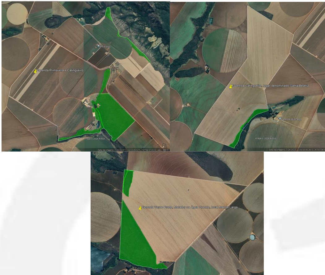
Figura 3 – Reserva legal no imóvel matriz.