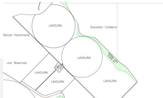
Figura 2 - Pivôs centrais com áreas de 40,0 ha e 44,0 ha.

02/2023, foram sobrestadas, temporariamente, as solicitações de captação consuntivas na Bacia do Rio Paracatu e na Bacia do Rio das Velhas. Portanto, o empreendedor fica condicionado à desmobilizar a captação e os equipamento de pivôs, caso a URGA NOR se manifeste pelo indeferimento da retificação.