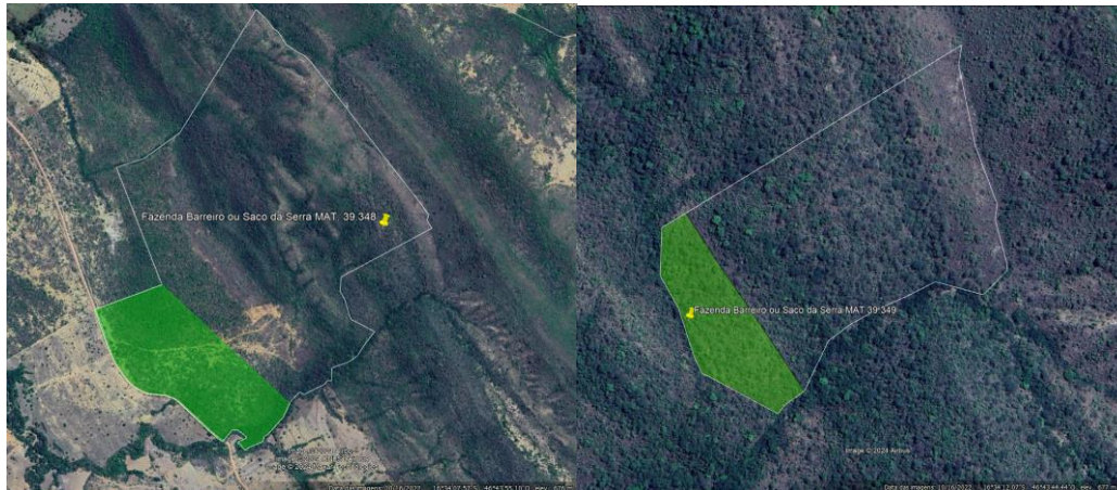
Figura 5 – Reserva legal própria, imóveis de compensação. .

Em análise às áreas de reserva legal dos imóveis de compensação, foi constatado as seguintes erosões: na Fazenda Barreiro ou Saco da Serra, matrícula 39.438, em 5,7086 ha (figura 6) localizada nas coordenadas geográficas 16°34'16.28"S/ 46°44'2.94"O, e em vários pontos inseridos na Fazenda Quebradas matrícula 8.984. Todos esses existentes desde data anterior à 22/07/2008, se tratando de uso antrópico consolidado, para a qual será condicionado apresentação de projeto de recuperação.