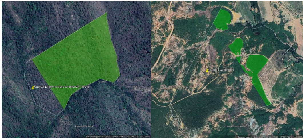
Figura 4 – Reserva legal compensação em outros imóveis.

Vale ressaltar que os imóveis utilizados para compensação de reserva legal do empreendimento possuem a seguinte regularização de reserva legal própria: