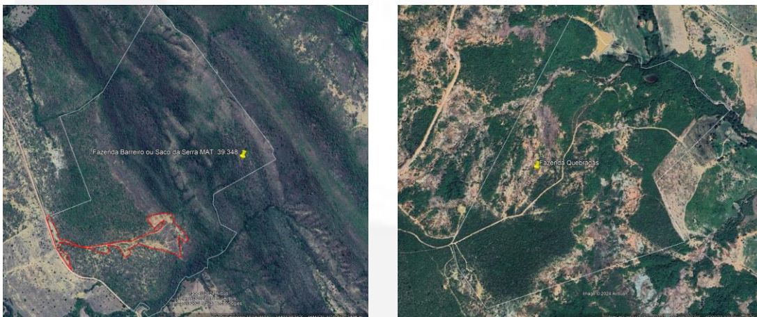
Figura 6 – Área de reserva legal a ser recuperada.

Em análise às áreas de reserva legal dos imóveis de compensação, foi constatado as seguintes erosões: na Fazenda Barreiro ou Saco da Serra, matrícula 39.438, em 5,7086 ha (figura 6) localizada nas coordenadas geográficas 16°34'16.28"S/ 46°44'2.94"O, e em vários pontos inseridos na Fazenda Quebradas matrícula 8.984. Todos esses existentes desde data anterior à 22/07/2008, se tratando de uso antrópico consolidado, para a qual será condicionado apresentação de projeto de recuperação.