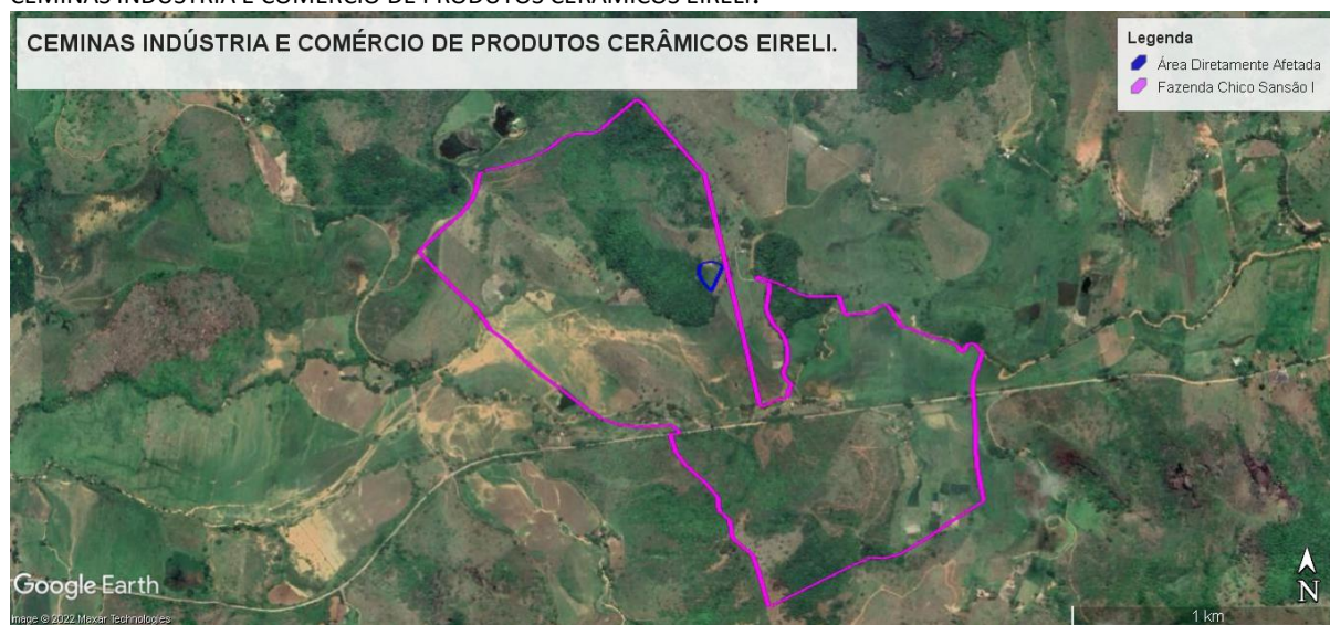
Figura 1: Área do imóvel rural Fazenda Chico Sansão I e da área diretamente afetada (ADA) pelo empreendimento CEMINAS INDÚSTRIA E COMÉRCIO DE PRODUTOS CERÂMICOS EIRELI.

O imóvel onde se localiza o empreendimento, encontra-se matriculado no Serviço Registral de imóveis da Comarca de Caratinga com o nº 45.415 fl. 01, livro 2. A propriedade, denominada Fazenda Chico Sansão I, situa-se no local denominado Córrego do Boi, zona rural do município de Vargem Alegre - MG, possui 174,00ha (8,7007 módulos fiscais), estando os 12 proprietários descritos no documento do imóvel.