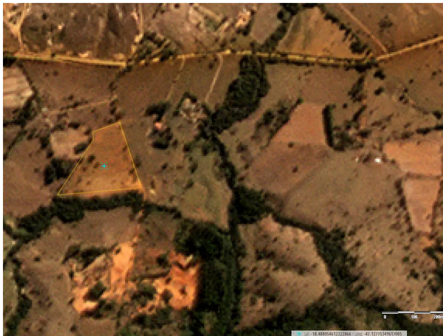
Figura 1: Imagem de satélite, composição RGB, de julho de 2022, antes do início da instalação na área do empreendimento (cruz azul no ponto central da área). São observados indivíduos arbóreos no local.