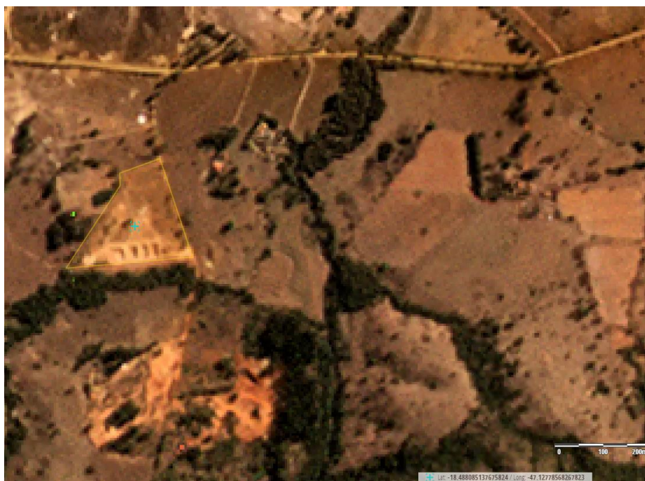
Figura 2: Imagem de satélite, composição RGB, de agosto de 2022, após início da instalação na área do empreendimento (cruz azul no ponto central da área). São observados indivíduos arbóreos que foram