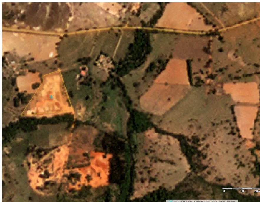
Figura 3: Imagem de satélite, composição RGB, de outubro de 2022, durante a instalação na área do empreendimento (cruz azul no ponto central da área). São observados indivíduos arbóreos que foram suprimidos no local.