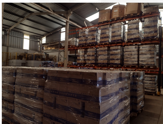
Área de expedição de produtos acabados