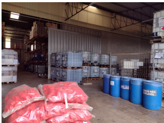
Área de armazenagem de matérias primas