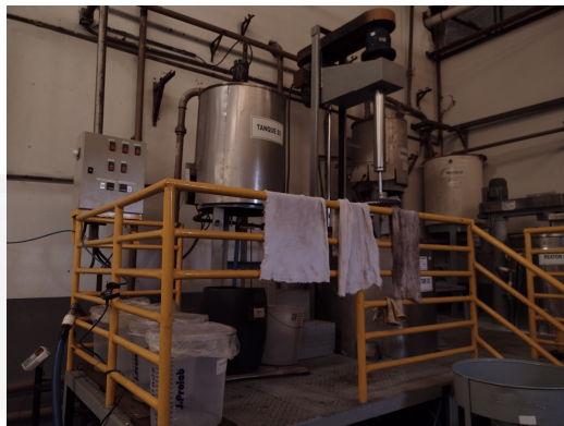
Área de produção