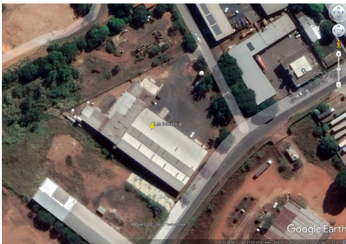
Figura 1: Localização do empreendimento.

O empreendimento encontra-se situado na Rua Sebastiana Frutuoso de Jesus 55, Bairro Distrito Industrial, Uberlândia/MG: