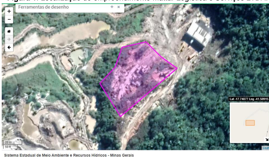
Figura 1. Localização do empreendimento Mattar Logística e Serviços LTDA.