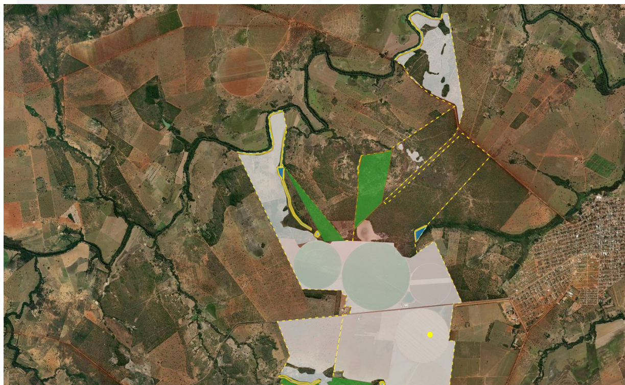
Figura 3. Reserva Legal do empreendimento conforme averbações nas matrículas e CAR. Acesso ao Sicar em: 12/06/2023.

A área de Reserva Legal proposta no CAR é de 137,34 hectares, o que totaliza uma área de Reserva Legal de 431,37 hectares (20,14%). A figura 3 apresenta a localização das áreas de Reserva Legal do empreendimento conforme declarados no CAR e aprovadas por esta Superintendência.