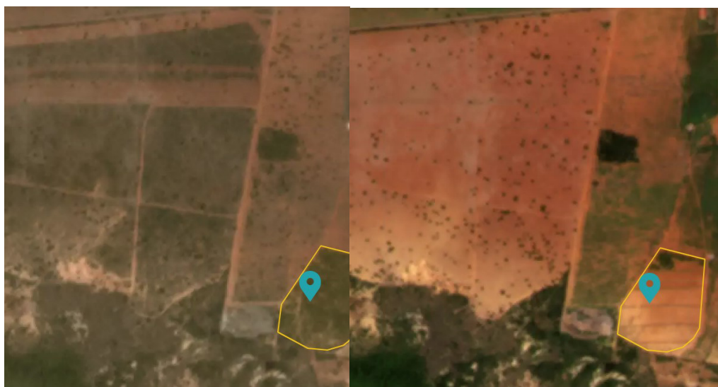
Figura 4. Área objeto do AIA corretivo. A esquerda área com vegetação nativa em novembro de 2020. À direita, área após a supressão em dezembro de 2020.

Foi realizado inventário florestal no empreendimento, com objetivo de caracterização da flora para o EIA/RIMA, e, por proximidade e similaridade fitofisionômica, utilizou-se a parcela 28 para estimar a volumetria da área suprimida. Segundo o inventário florestal, a parcela 28 possui volumetria estimada de 23,6599 m 3 /ha. A partir desta estimativa, foi acrescido o volume de 10% de tocos e raízes, chegando no valor total de lenha de 255,06 m 3 .