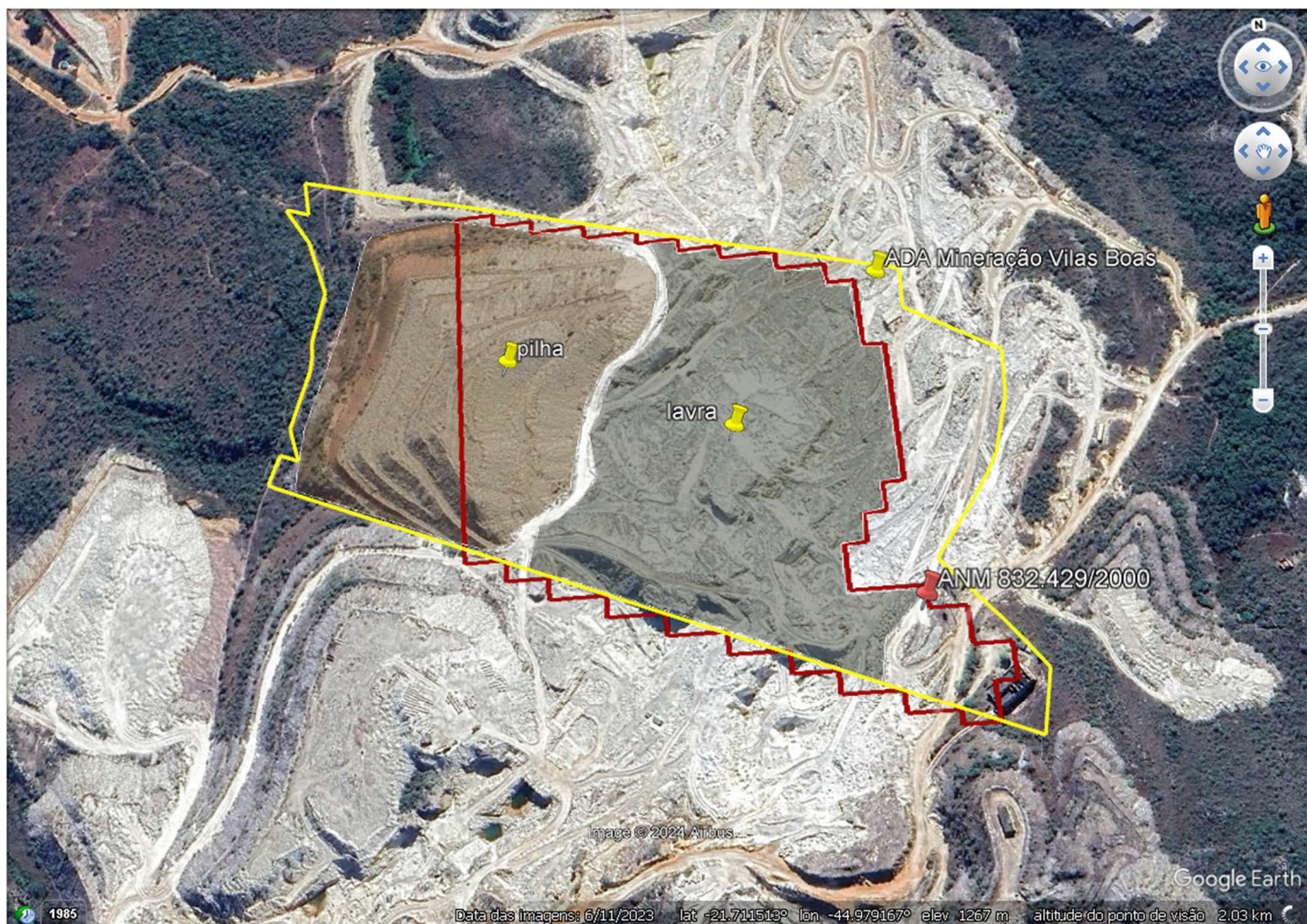
Figura 1 - Localização do empreendimento.

A Mineração Vilas Boas Ltda, inscrito no CNPJ sob nº 01.543.729/0001-77, exerce as atividades de extração de quartzito e pilha, através do Certificado REV-LO nº 78/2016, vinculado ao direito minerário – ANM nº 832.429/2000, com condicionantes e vencimento em 24/08/2024, na zona rural de São Thomé das Letras, nas coordenadas de referência 21°42'31.8"S e 44°58'44.2"W (Figura 1).