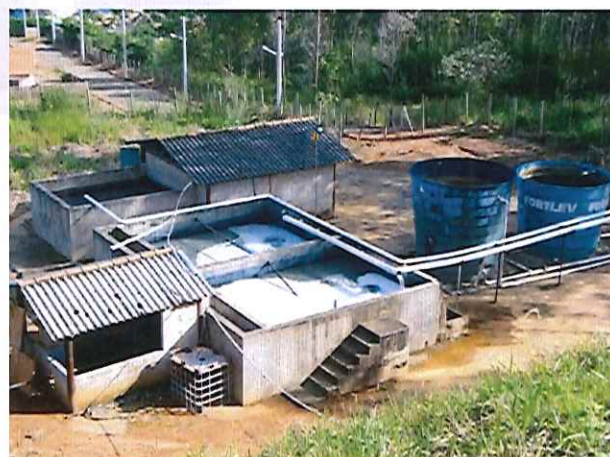
Foto 02. Estação de tratamento de efluentes Industriais