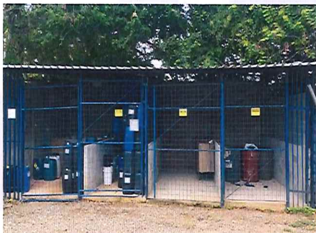
Foto 01. Depósito de resíduos