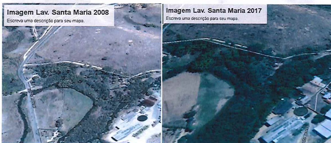
Figura: 03 – Vista da área do empreendimento, com as estruturas presentes na APP do curso d'água por ocasião da regularização da intervenção e as mesmas estruturas atualmente.

Por fim, ressalta-se que não foram verificadas novas intervenções em APP na área do empreendimento, podendo tal situação ser comprovada inclusive com imagens do Google Earth, conforme figuras abaixo: