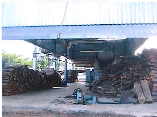
Foto 03. Caldeira e depósito de lenha