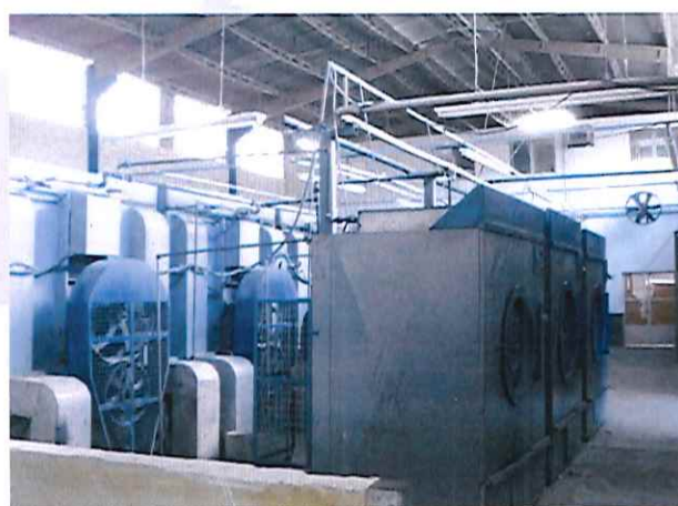
Foto 04. Área interna do galpão