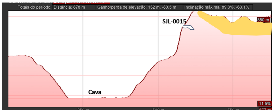
Figura 02 - Face sul do maciço de inserção da cavidade SJL-0015. Fonte: Relatório Técnico nº 7/FEAM/URA CM - CAT/2024 (84935192 e 85005587)