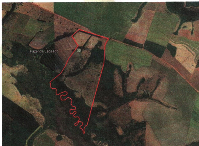
Figura 01: Localização Fazenda Lageado