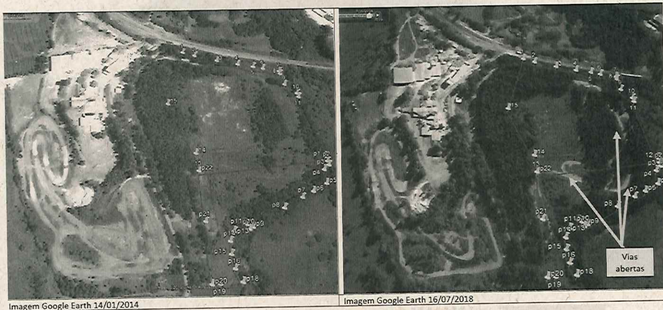
Figura 2. Vias de acesso abertas/utilizadas nas áreas de Reserva Legal.

Ao avaliar as condições das referidas áreas através de imagens de satélite, verificou-se que foram abertas e/ou utilizadas vias de acesso no interior das áreas de Reserva Legal entre os anos 2014 e 2016, conforme ilustrado na Figura 2 abaixo.