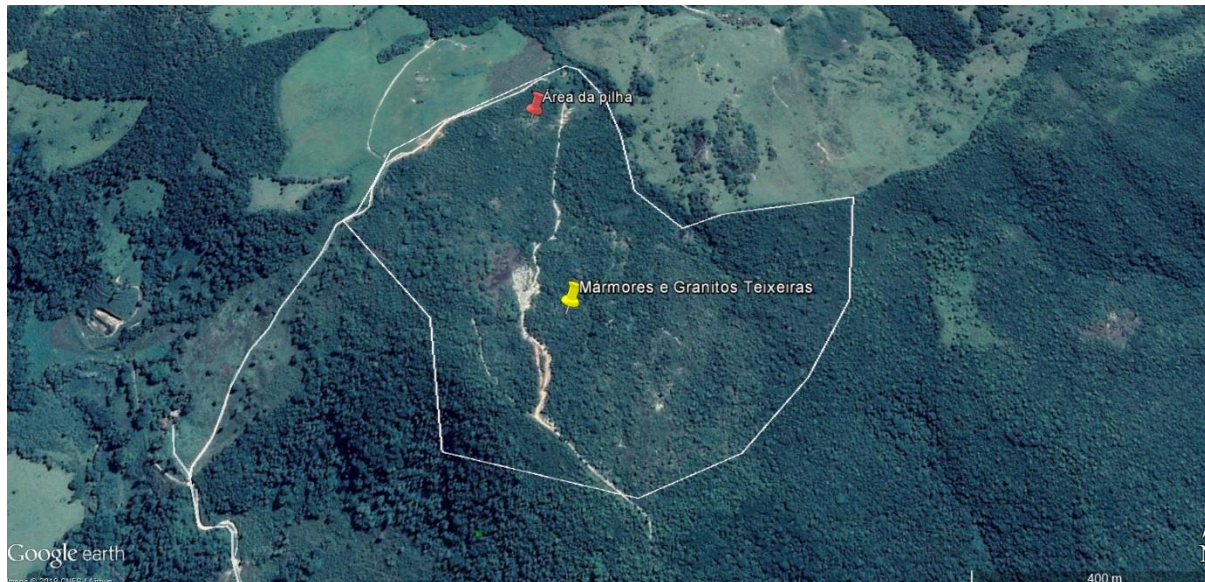
Imagem 02- Área onde se localizará a pilha de rejeitos.