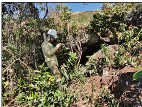
Foto 7.151 - Porção externa da Cavidade AVG-45.