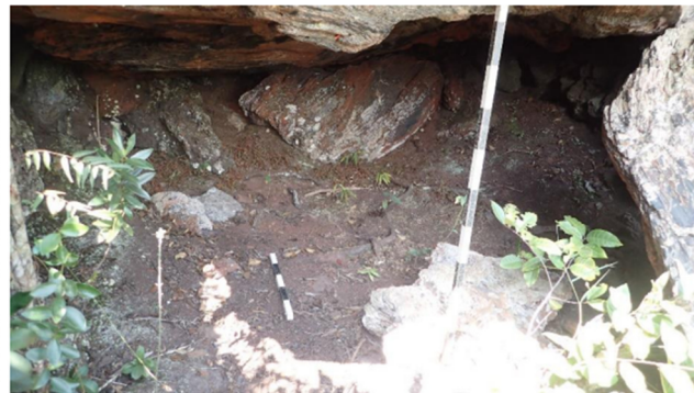
Foto 100 - Piso do salão da cavidade AVG-0060.

A cavidade AVG-60 situa-se dentro da ADA do empreendimento, sendo que no Parecer Único nº 078/2018 (SIAM 0376446/2018) já constava a intenção do empreendedor em suprimir a cavidade AVG-60 por estar essa em área de pit final da Cava II (Figura 03). A cavidade está inserida em um grupo de área de influência espeleológica, denominado no PU como Grupo 3 que além da AVG-60 abarca ainda as cavidades AVG-18, AVG-19 e AVG 20, todas estas últimas já com autorização de supressão expressa no Parecer Único nº 078/2018 (SIAM 0376446/2018) e em seu Adendo (SIAM 0570917/2018).