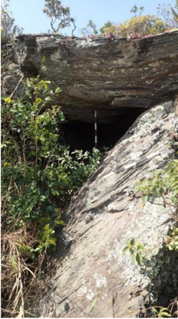
Foto 98 - Entrada da cavidade AVG-0060.

Figura 02: Fotos da cavidade AVG-60, objeto de supressão. Fonte: Relatório Técnico avaliação arqueológica Ativo Ambiental, 2022 (SEI 53222943)