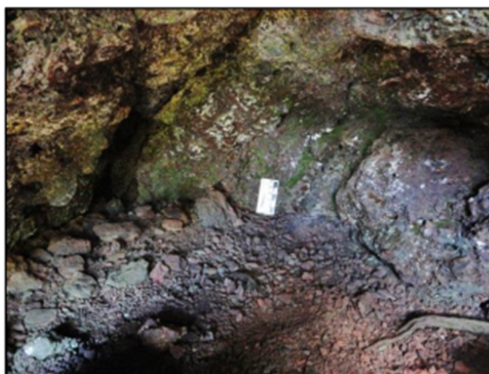
Foto 7.152 - Porção interna da Cavidade AVG-45.