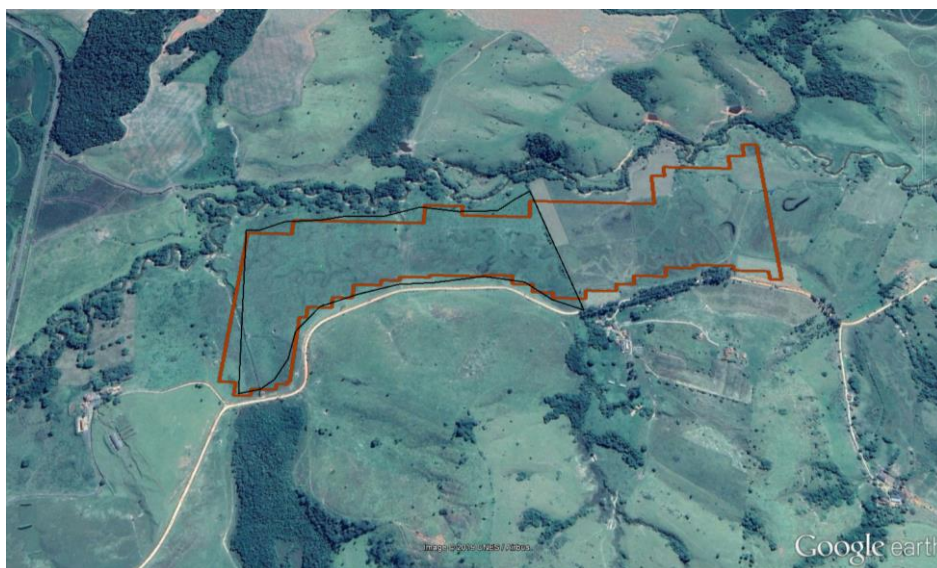
Figura 01: Imagem do Google Earth da área do empreendimento.

A Figura 01 abaixo permite visualizar a Área Diretamente Afetada – ADA do empreendimento, bem como seu entorno.