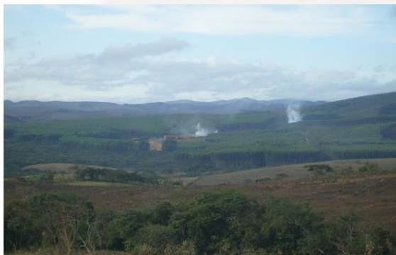
Foto 01. Vista do empreendimento e dos fornos.