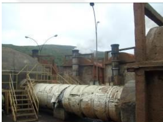
Foto 03. Vista parcial do queimador de gases – duto na saída do forno para coleta e condução dos gases da carbonização.