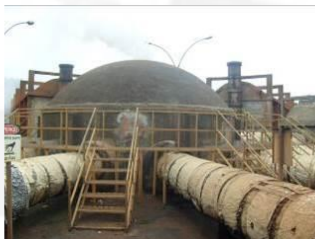
Foto 04. Dutos ligados ao misturador dos gases para homogeneizá-los antes da queima no queimador de gases.