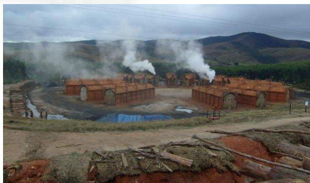
Foto 02. Vista da Unidade de Produção de Carvão - UPC.