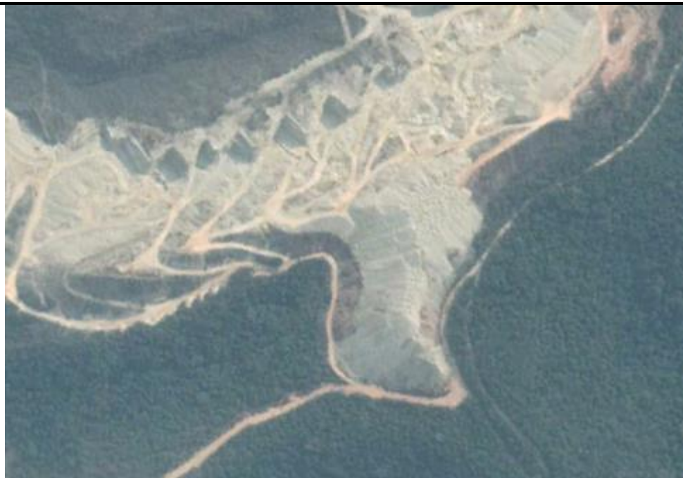
Figura 1 : Pilha desativada, indo além da linha de cumeeira.

Tal aporte de rejeitos na área de cumeeira representa não apenas intervenção em APP, mas significativa alteração na paisagem, tendo em vista a relevância desta serra e de seu maciço florestal no panorama ambiental municipal. Trata-se, ainda, de uma região inserida em zona de amortecimento da Reserva da Biosfera da Mata Atlântica, segundo IDE-Sisema. Não foi apresentado nenhum PRAD para a recuperação desta pilha.