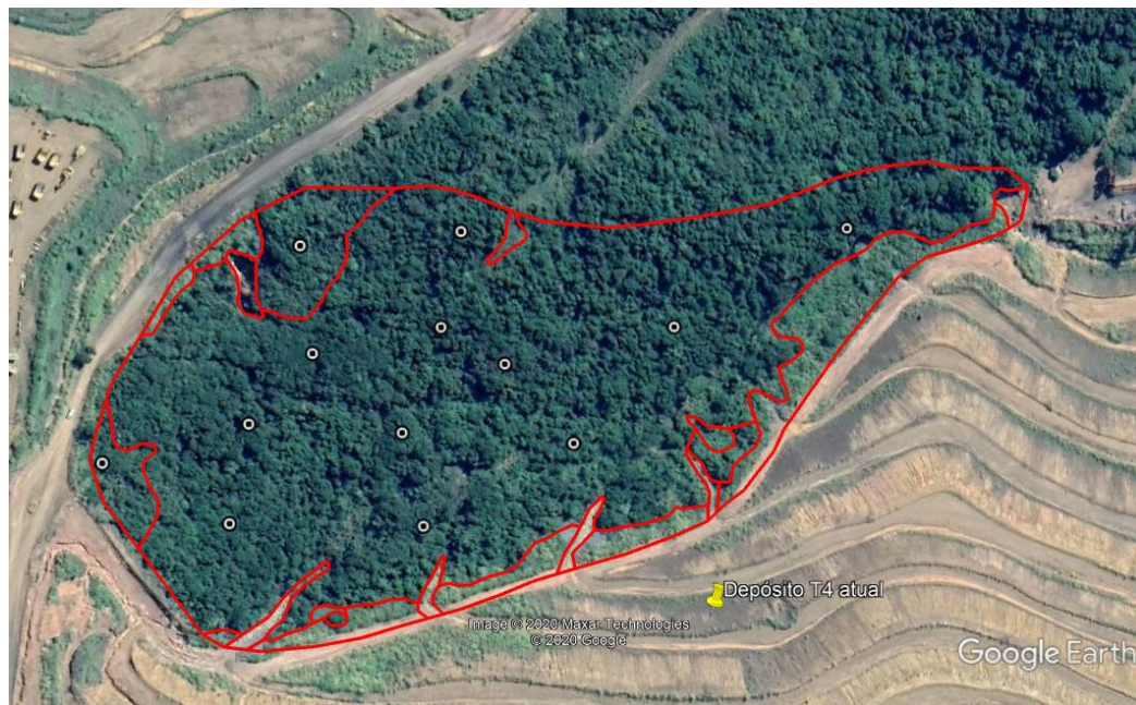
Imagem 02: Localização das parcelas amostradas.

A imagem a seguir identifica os pontos centrais de cada parcela alocada e a tabela em sequência aponta as coordenadas geográficas de cada uma: