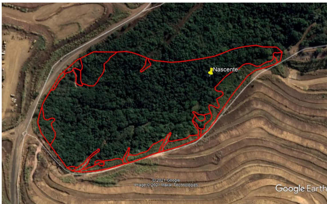
Imagem 04: Localização da nascente a ser suprimida.

Para a supressão da nascente e construção do dreno, o empreendimento possui Portaria para canalização e retificação de curso d'água junto ao IGAM, conforme Portaria IGAM 1904383/2019, válida até 19/06/2024.