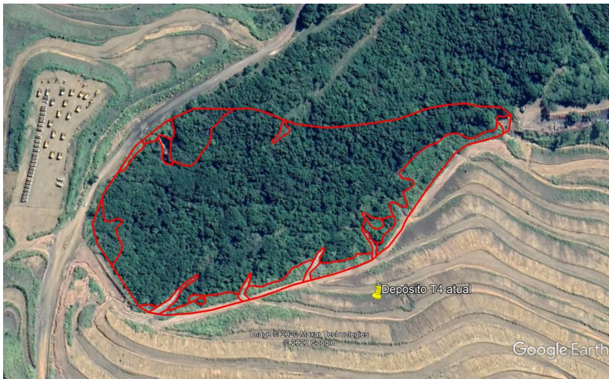
Imagem 01 – Área Diretamente Afetada pela pilha de estéril e pela nova estrada de acesso.

A geometria dos taludes dos diversos depósitos de estéril do CMT é semelhante. Os bancos individuais apresentam-se, quase sempre, com 10 m de altura, bermas de 15 m de largura, e inclinação do talude correspondendo ao ângulo de repouso dos materiais, quase sempre próximo a 34° (1V:1,5H).