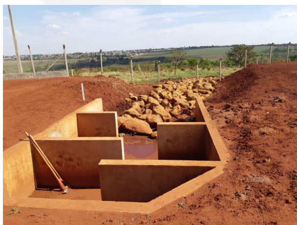
Foto 03. Dissipador de energia seguido por enrocamento