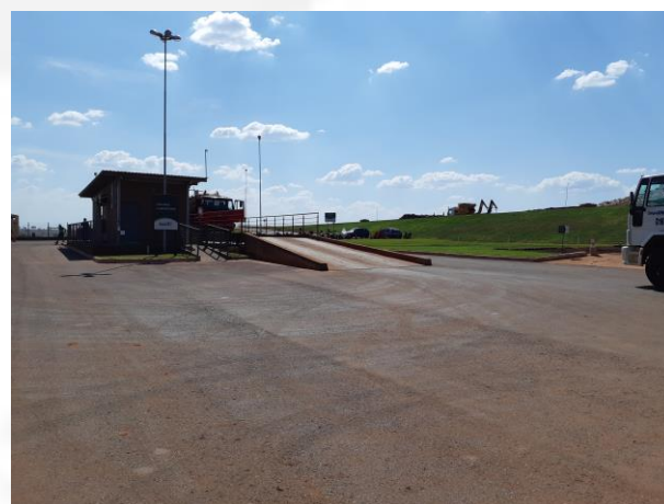
Foto 02. Balança/laboratório