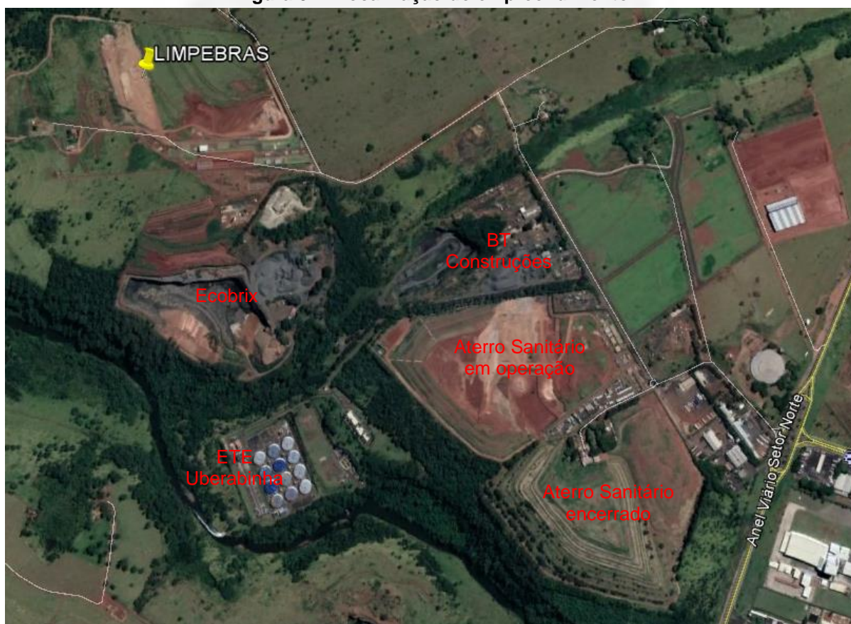
Figura 01 - Localização do empreendimento