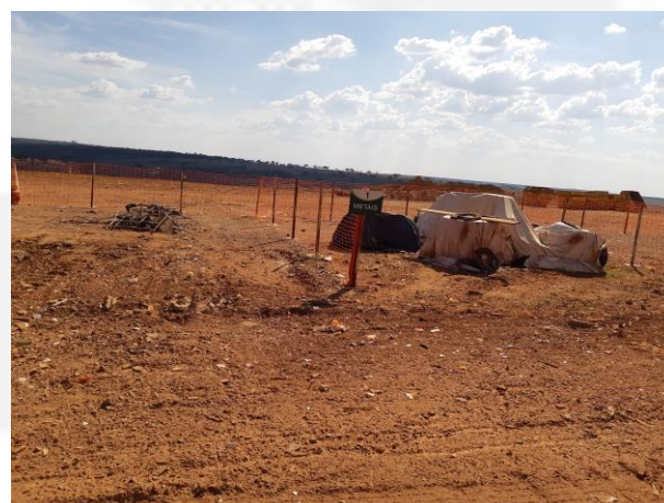
Foto 04. Aterro de RCC/baias identificadas para segregação de resíduos