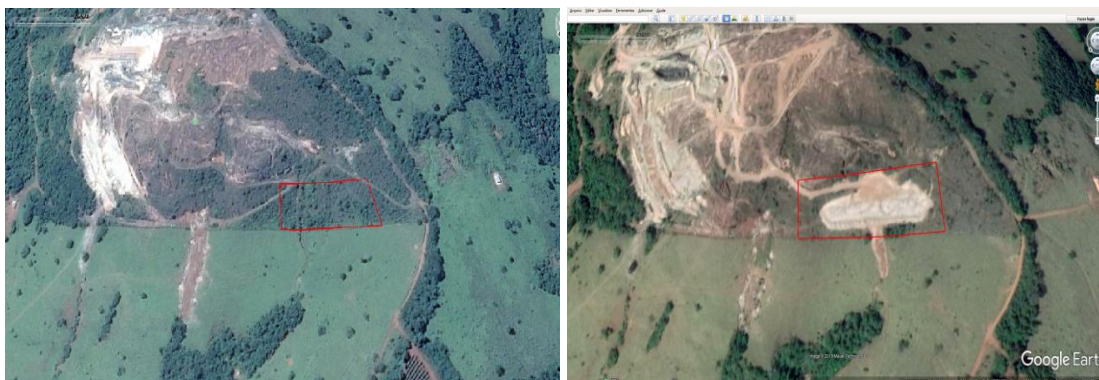
Figura 1: Imagem da esquerda obtida em 26/03/2017 mostrando a área antes da intervenção, e imagem da direita obtida em 10/09/2018 mostra a área sem a vegetação nativa.

Em consulta ao IEF não foi encontrada nenhum documento que autorize qualquer tipo de intervenção ambiental. Porém, pelas imagens de satélites mostradas abaixo é possível ver que ocorreu intervenção ambiental com supressão de vegetação nativa (figura 1).