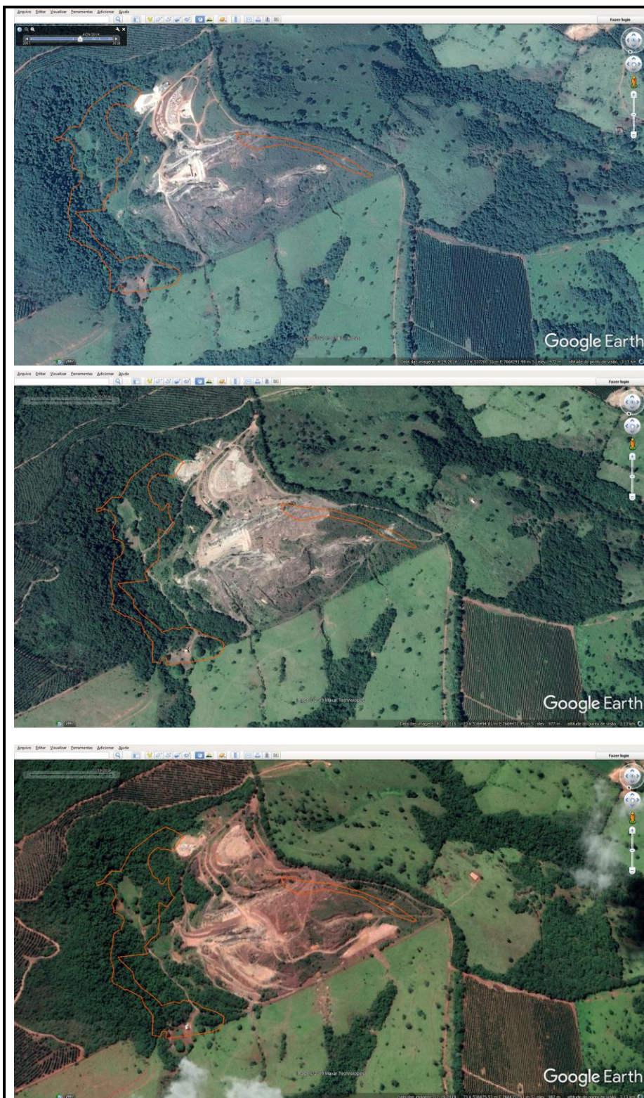
Figura 2: Imagens mostrando a intervenção ambiental na área de Reserva Legal

Além dessas intervenções ambientais o empreendimento também desenvolveu a atividade de disposição de estéril/rejeito em pilha, listada na DN COPAM nº.217/17, sendo, portanto, passível de