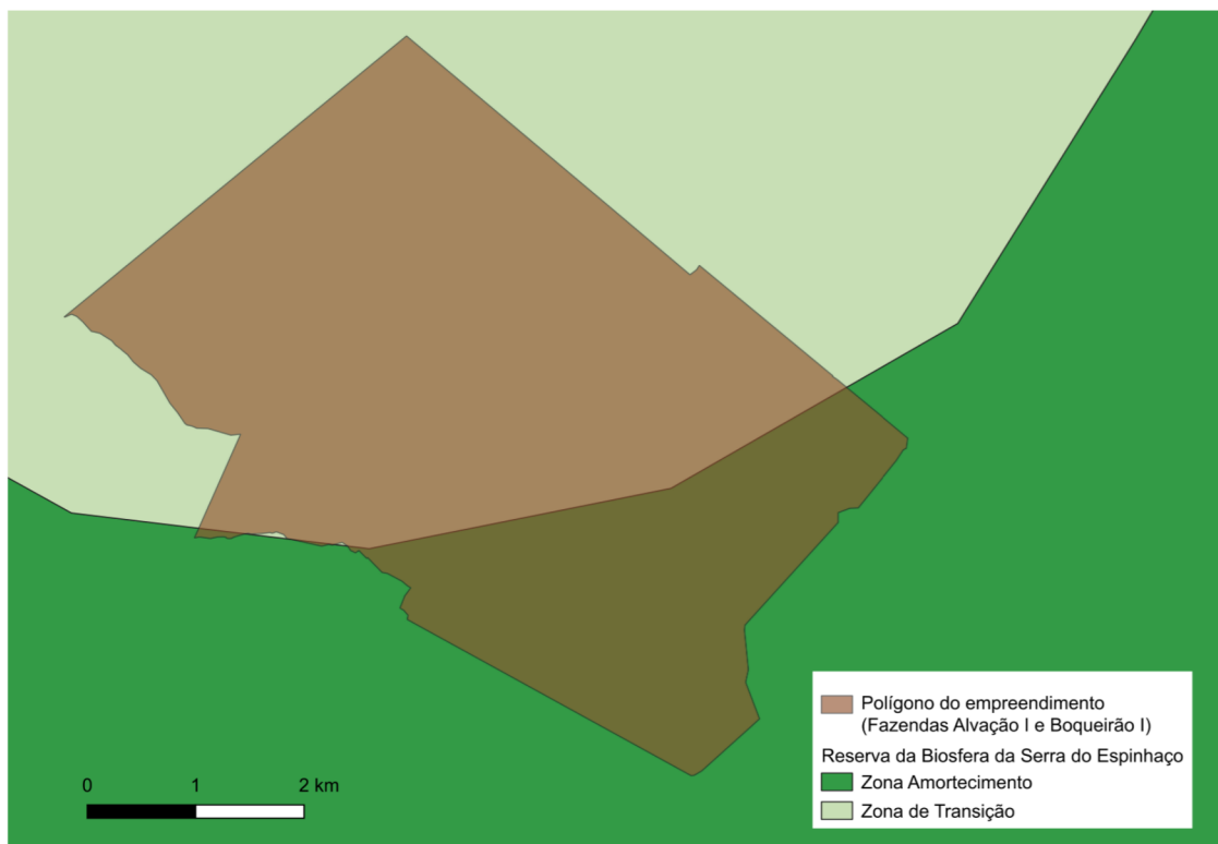
Figura 02. Localização do empreendimento na Reserva da Biosfera da Serra do Espinhaço.

Deste modo verifica-se a incidência do critério locacional “Localização prevista em Reserva da Biosfera, excluídas as áreas urbanas” cujo peso é igual a 1 conforme item 4 do anexo único da DN COPAM 217/2017.