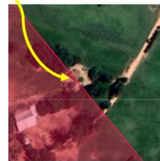
Figura 1. Limite do empreendimento Leopoldo Antônio Pereira - Fazenda Capão Alto delimitado na plataforma do SLA.

O processo administrativo em questão, LAS 1256/2020 foi cadastrado em 16/03/2020 com requerimento de licença publicado em 03/04/2020 visando à obtenção de Licenciamento Ambiental Simplificado subsidiado por Relatório Ambiental Simplificado – LAS/RAS para as atividades listadas na Deliberação Normativa Copam 217/2017 sob código “G-02-08-9 - Criação de bovinos, bubalinos, equinos, muares, ovinos e caprinos, em regime de confinamento” para um número de cabeças de 950; “G-01-03-1 - Culturas anuais, semiperenes e perenes, silvicultura e cultivos agrossilvipastoris, exceto horticultura” para uma área útil de 50 ha e “D-01-07-4 - Resfriamento e distribuição de leite em instalações industriais e/ou envase de leite fluido” para uma capacidade instalada de 10.000 L/dia.