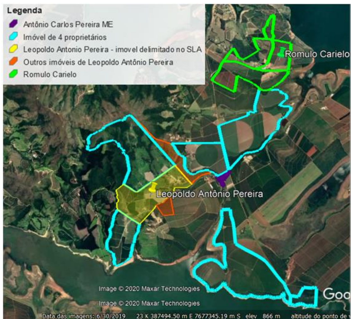
Figura 2. Verificação de imóveis rurais junto ao CAR para análise do processo em questão.