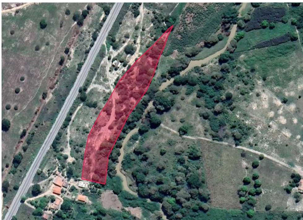
Imagem 1: ADA do empreendimento retirada do SLA.

A imagem abaixo foi retirada do Sistema de Licenciamento Ambiental – SLA que determina que seja apresentado “o espaço territorial escolhido para o desenvolvimento de sua atividade”.