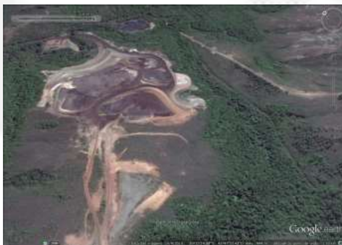
Figura 2: Pilha de Estéril de 18,9 hectares que foi implantada no empreendimento.

A pilha de produtos possui área final de 18,9 ha. Tratava-se de área constituída por cobertura vegetal representada por campo cerrado com elevado grau de antropização, além de áreas degradadas exemplificadas pelas voçorocas, já estabilizadas, que após todo tratamento necessário (drenagem de fundo, estudos geotécnicos) passou a estocar os produtos provenientes das UTM's. O material depositado nesta pilha é composto principalmente por produtos na granulometria arenosa (fração Sinter Feed - 74%), já desaguados. O percentual restante (26%) é composto por produtos finos, granulometria pellet feed. A taxa de geração destes produtos fora de especificação é de cerca de 475.000 t/ano.