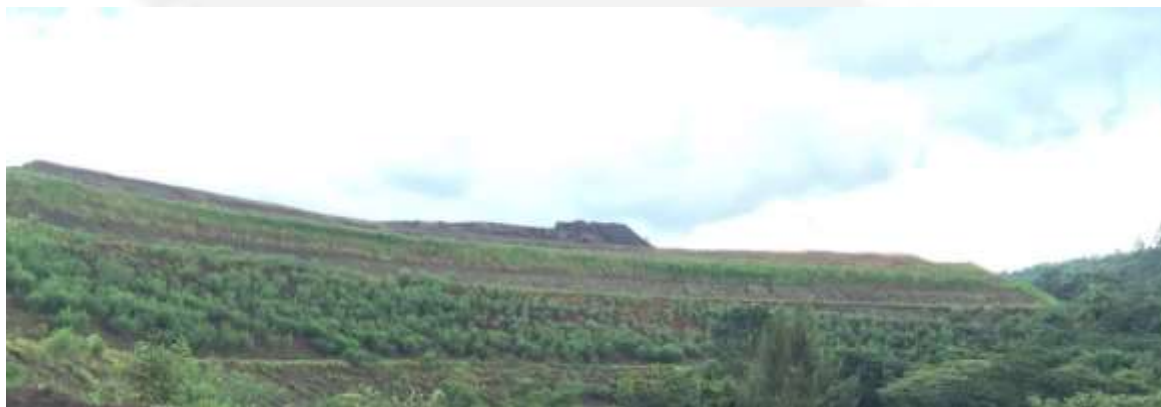
Figura 3: Pilha de Estéril do empreendimento

Em relação à condicionante nº 3, é apresentado abaixo foto de parte da pilha de estéril que utilizou a serapilheira depositada pelo empreendimento.