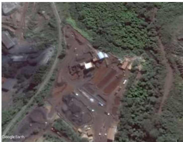
Figura 1: Vista Geral do empreendimento. Destaca-se as 3 baías de decantação implantadas em superfície.

A pilha de produtos possui área final de 18,9 ha. Tratava-se de área constituída por cobertura vegetal representada por campo cerrado com elevado grau de antropização, além de áreas degradadas exemplificadas pelas voçorocas, já estabilizadas, que após todo tratamento necessário (drenagem de fundo, estudos geotécnicos) passou a estocar os produtos provenientes das UTM's. O material depositado nesta pilha é composto principalmente por produtos na granulometria arenosa (fração Sinter Feed - 74%), já desaguados. O percentual restante (26%) é composto por produtos finos, granulometria pellet feed. A taxa de geração destes produtos fora de especificação é de cerca de 475.000 t/ano.