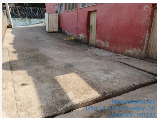
Foto 03. Área de lavagem do caminhão