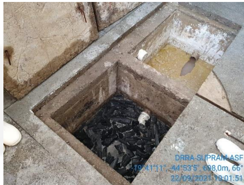
Foto 02. Visão da caixa de gordura e caixa com carvão e brita