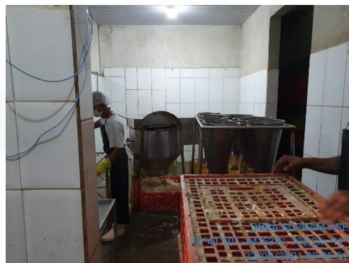
Foto 04. Área operacional