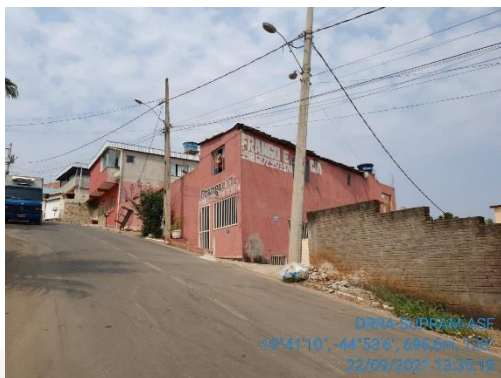
Foto 01. Visão da área externa do empreendimento