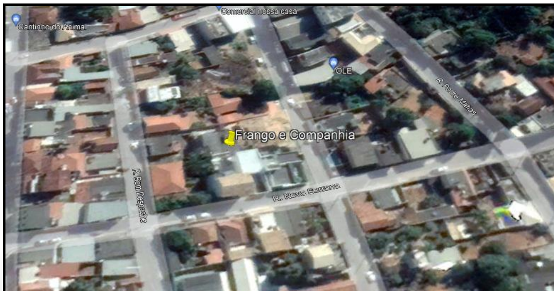
Figura 1: Localização do empreendimento Lorena Beatriz Campos Arcanjo / Frango e Companhia.

A seguir consta a imagem de satélite do Google Earth Pro no ano de 2021, referente a localização do empreendimento: