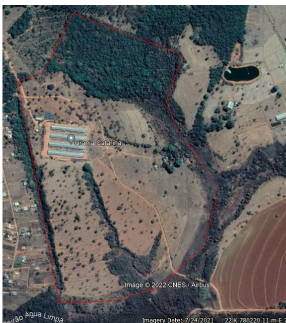
Figura 01. Vista aérea da propriedade delimitada em vermelho. Fonte: Google Earth (08/04/2022)

A área total do empreendimento é de 73,42 hectares, área construída 3,48 hectares, com presença de 06 funcionários fixos, 01 funcionário temporário e 06 famílias residentes.