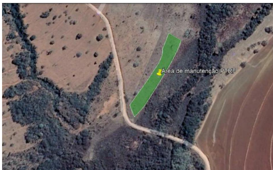
Figura 3: Área em recuperação demarcada na cor verde.