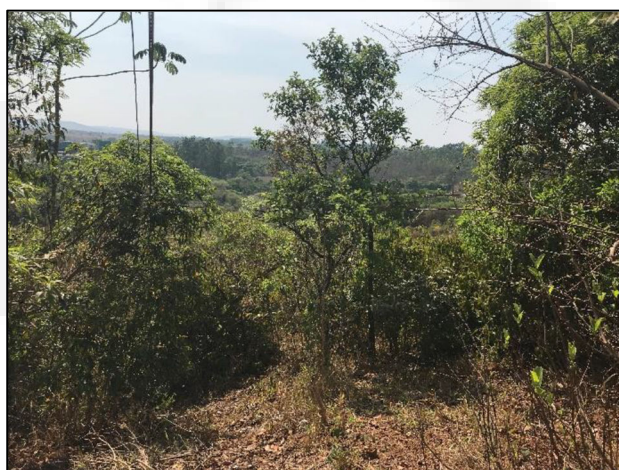
Figura 4: Reserva Legal.