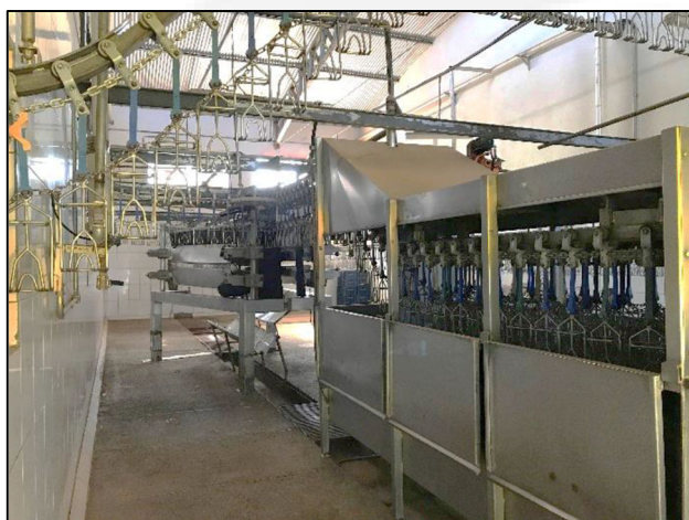
Figura 1: Processo produtivo.

Empreendedor: FRIGORIFICO MERCIFRAN LTDA Empreendimento: FRIGORIFICO MERCIFRAN LTDA (EX JOSE CAIXETA NASCENTES FILHO) CNPJ: 65.310.005/0001-66 Município: Patos de Minas Atividade: Abate de animais de pequeno porte (aves, coelhos, rãs, etc.) Código DN 74/04: D-01-02-3 Processo: 15691/2006/003/2019 Validade: -