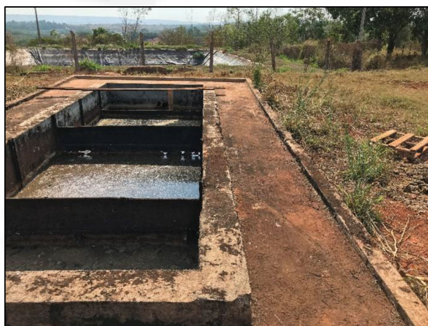
Figura 2: ETE.