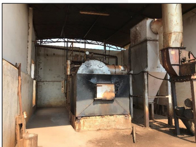
Figura 3: Caldeira.