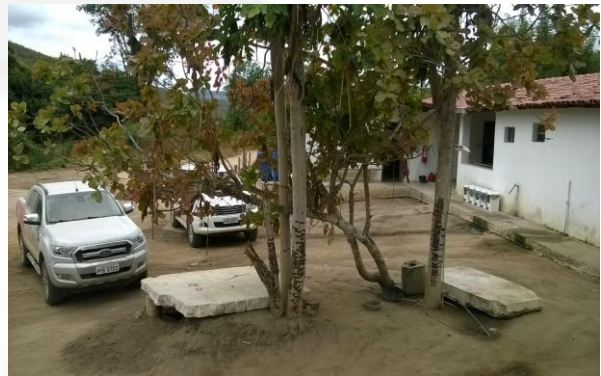
Foto 10. Alojamento.