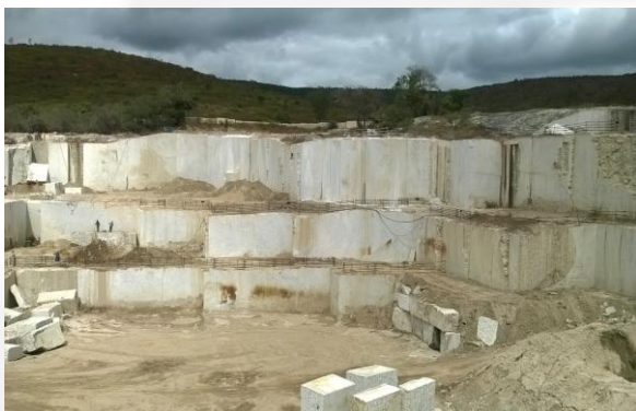
Foto 1. Frente de lavra a ser ampliada.