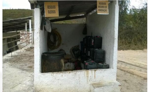
Foto 8. Depósito de resíduos oleosos.