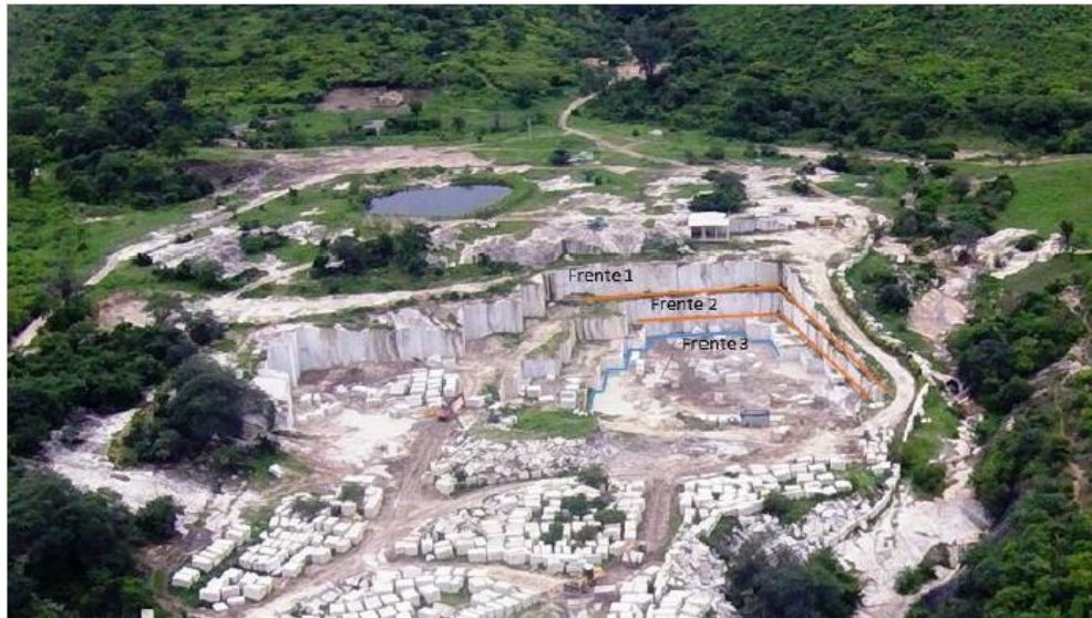
Figura 02: Frente de lavra White Springs - Fazenda Campestre.

A frente de lavra Monet está localizada na Fazenda Itinguinha e se encontra em funcionamento, possuindo apenas uma bancada, com projeto de uma bancada adicional que possibilitará a ampliação da produção da lavra. Atualmente esta frente de lavra possui uma pilha de rejeitos com capacidade final para abrigar rejeitos. Portanto, a pilha será alvo de alteamento com a devida disposição respeitando as normas referentes a inclinação e formação de taludes. A utilização da área da pilha contribuirá para se evitar novas supressões de vegetação, possibilitará a reconformação topográfica da área facilitando a recuperação posterior do local e apresenta menor impacto visual.