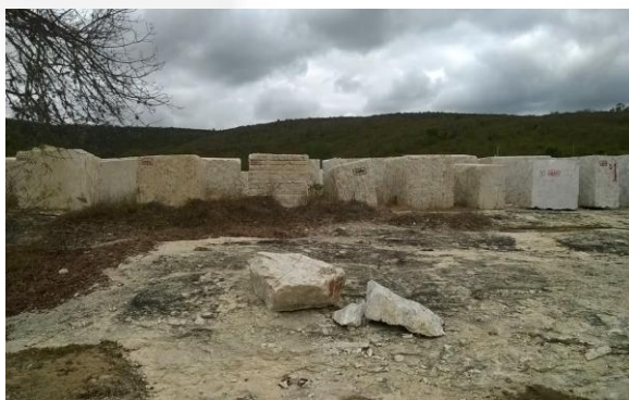
Foto 3. Área de depósito de blocos.