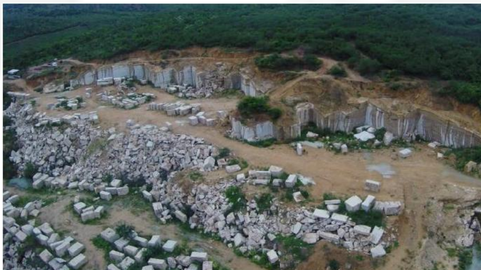
Figura 03: Frente de lavra Monet - Fazenda Itinguinha.

A frente de lavra Monet está localizada na Fazenda Itinguinha e se encontra em funcionamento, possuindo apenas uma bancada, com projeto de uma bancada adicional que possibilitará a ampliação da produção da lavra. Atualmente esta frente de lavra possui uma pilha de rejeitos com capacidade final para abrigar rejeitos. Portanto, a pilha será alvo de alteamento com a devida disposição respeitando as normas referentes a inclinação e formação de taludes. A utilização da área da pilha contribuirá para se evitar novas supressões de vegetação, possibilitará a reconformação topográfica da área facilitando a recuperação posterior do local e apresenta menor impacto visual.