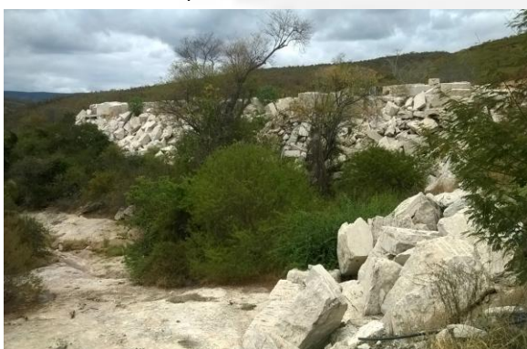
Foto 5. Pilha de rejeito/estéril.