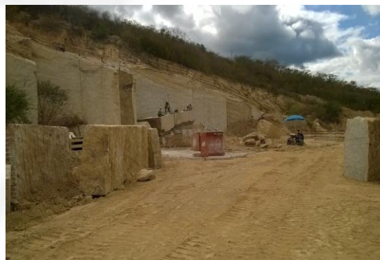
Foto 2. Frente de lavra a ser ampliada.