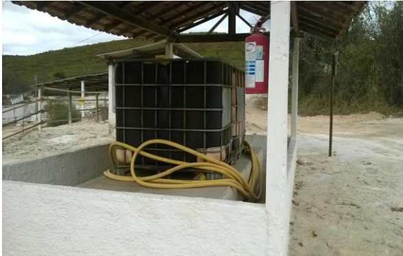
Foto 7. Tanque de abastecimento.