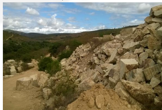
Foto 6. Pilha de rejeito/estéril.