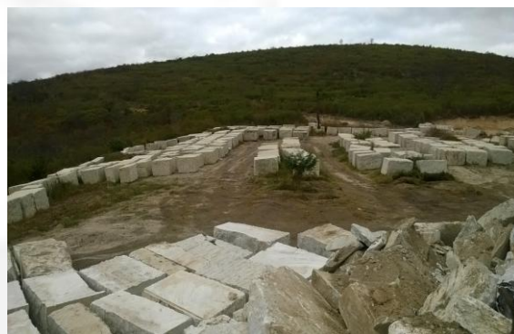
Foto 4. Área de depósito de blocos.