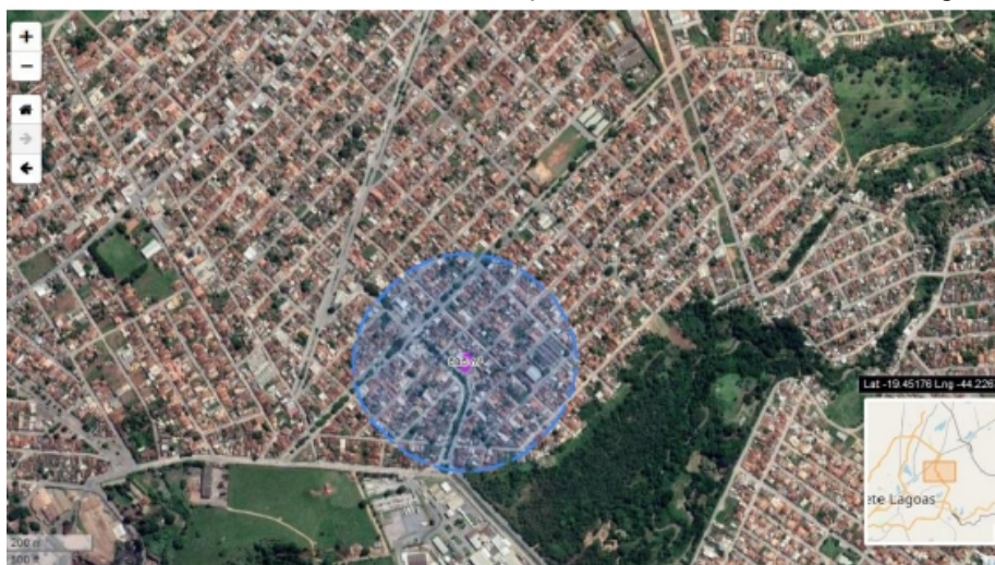
Figura 01: Raio de 250 m do entorno do empreendimento Auto Posto Woltagem Ltda.