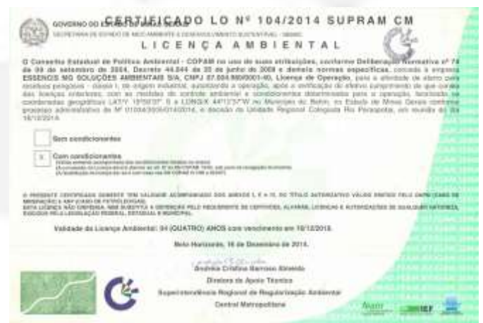
Certificado de regularização da empresa Essencis.