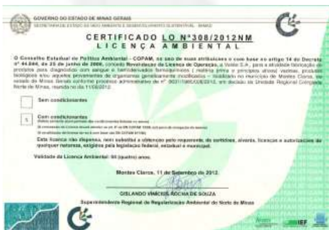
Certificado de regularização da empresa Vallée.

Tanto a empresa Vallée S.A. como a Essencis MG Soluções Ambientais possuem regularização ambiental para as atividades de fabricação de vacinas de uso veterinário e aterro para resíduos perigosos, respectivamente. Abaixo, seguem cópias dos certificados de Licença de Operação – LO, das referidas empresas.