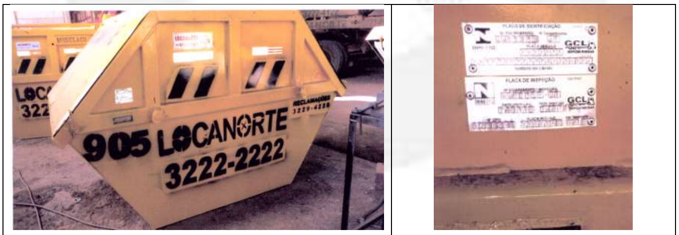
Caçambas que irão armazenar os resíduos a serem transportados.