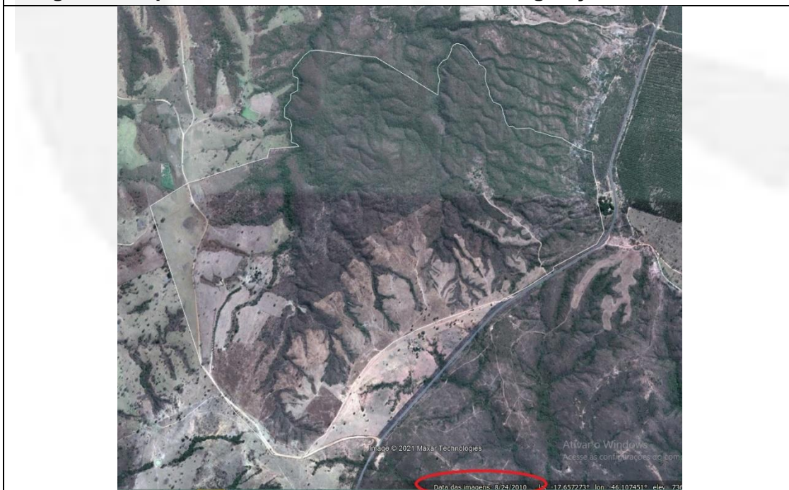
Imagem 2. Empreendimento com uma parte de desmate para pastagem. Data: 24/08/2010