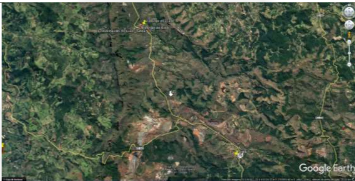
Figura 04: Vista geral da área do entorno do empreendimento, localizado na zona rural de Ouro Preto e comunidades do Ribeirão do Eixo e do Pires.