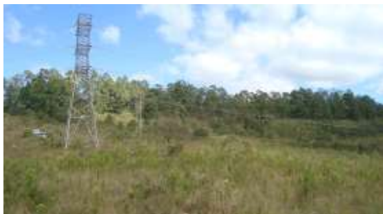
Foto 01. Vista da área de instalação da planta de beneficiamento com presença de vegetação exótica na antiga pilha de estéril e vegetação nativa em primeiro plano.