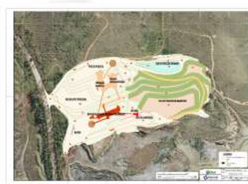
Figuras 01 e 02. Vista das instalações do empreendimento antes e depois da alteração respectivamente, que consistiu na retirada das duas pilhas ao norte (cor verde) e reorientação da planta de beneficiamento.