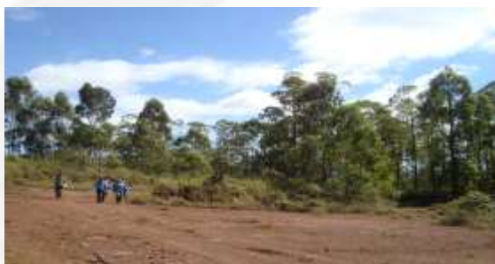
Foto 03. Idem Foto 01 de outro ângulo, onde será construída a planta de beneficiamento, pilha de estéril e anexos.