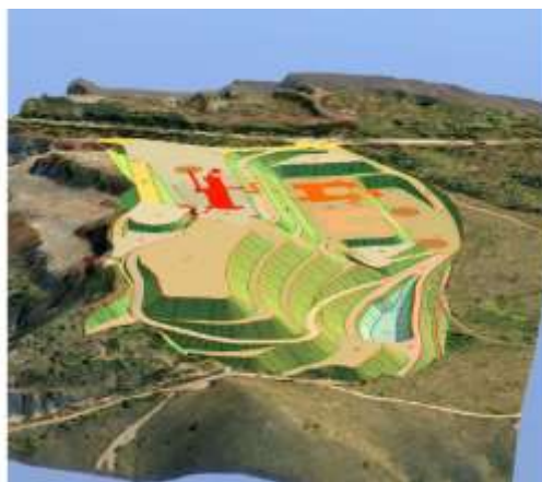
Figura 03. Vista em 3D das instalações do empreendimento demonstrando a pilha de estéril em primeiro plano com a respectiva bacia de contenção de finos a jusante e UTM.

A pilha foi projetada com concepção e geometria capazes de garantir fatores de segurança adequados conforme estabelecido na normatização brasileira (ABNT NBR 13029/2006). O projeto foi baseado em sondagem SPT para avaliação das características da fundação e por ensaios de caracterização do material a ser armazenado.