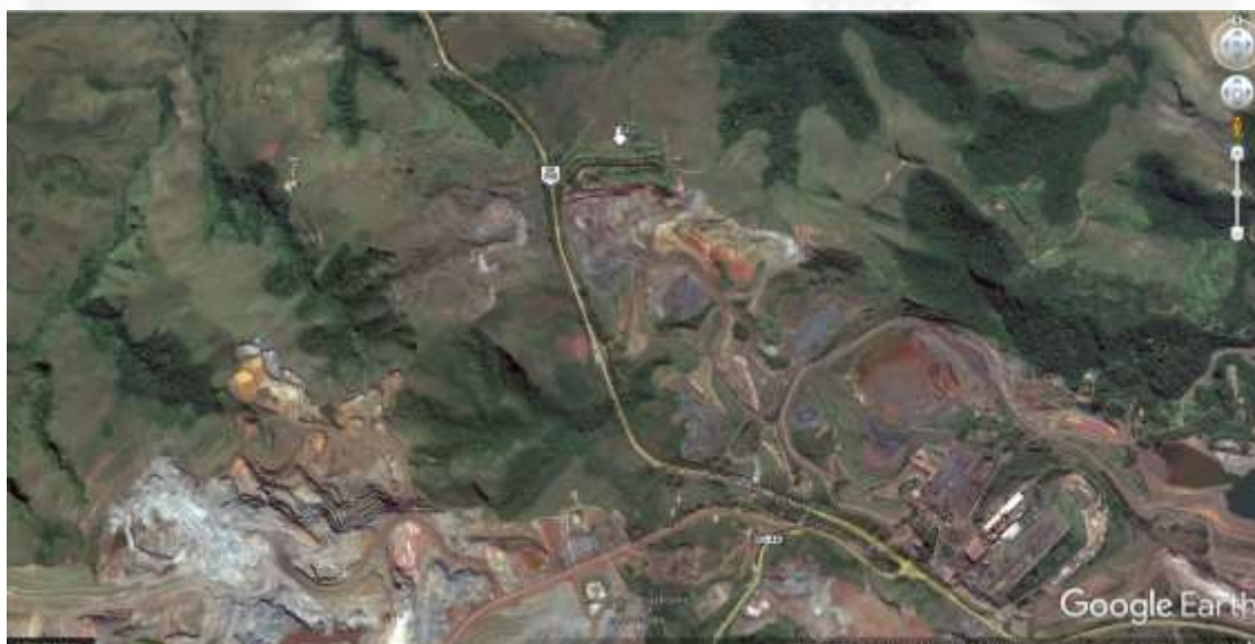
Figura 05: Detalhe da imagem anterior do empreendimento e complexos minerários localizado ao sul da área.