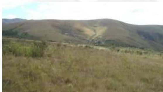
Foto 04. Entorno do empreendimento com presença de vegetação nativa.