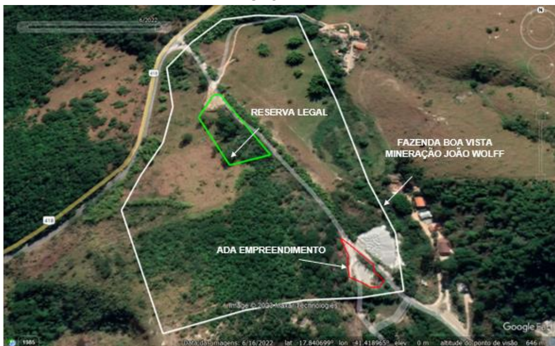
Figura 1. Local onde se pretende instalar o empreendimento GF ENGENHARIA E TRANSPORTE LTDA.