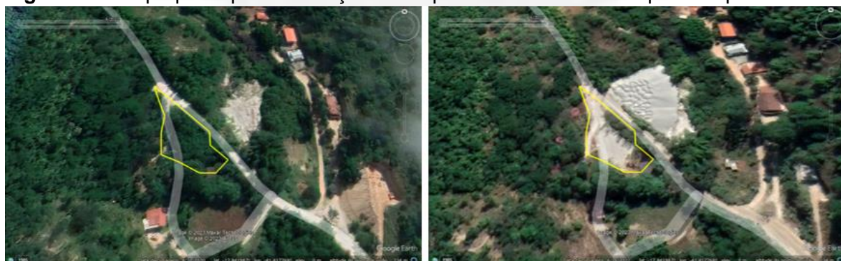
Figura 3. Área proposta para instalação do empreendimento antes e após a supressão.

Ocorre, porém, que entre 07/06/2023 e 16/06/2022, houve supressão da cobertura vegetal nativa, conforme verifica-se na Figura 3 a seguir, não tendo sido apresentado o ato autorizativo para realizar tal intervenção ambiental. Ressalta-se que na caracterização do processo no SLA foi informado, nos campos relativos aos códigos 07027, 07029, 07032 e 07034, que não havia intervenção ambiental a ser regularizada e/ou autorizada na área do empreendimento, nos termos do art. 3º do Decreto Estadual n. 47.749/2019. O mesmo foi informado também no estudo relativo ao critério locacional.