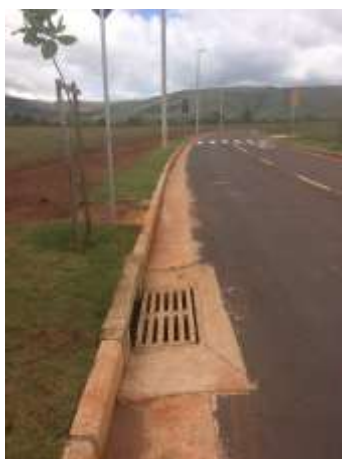
Foto 01. Drenagem e sinalização.