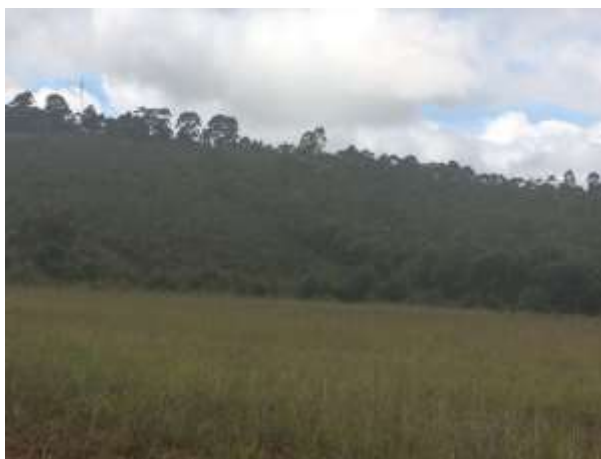
Foto 02. Área manejo florestal.