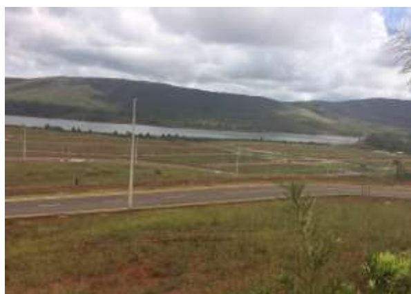
Foto 03. Pavimentação das vias.