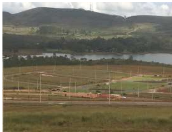
Foto 04. Iluminação pública.