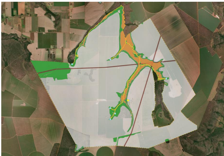
Figura 2. Áreas de Reserva Legal no interior do empreendimento Fazenda Lages LG Capão Grande. Acesso ao CAR em: 03/03/2023.

Desta forma, a área de reserva legal do empreendimento é composta por 1.107,93 hectares, quantidade superior ao exigido na legislação vigente.