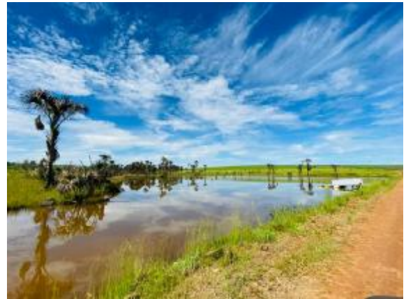
Foto 02. Barramento