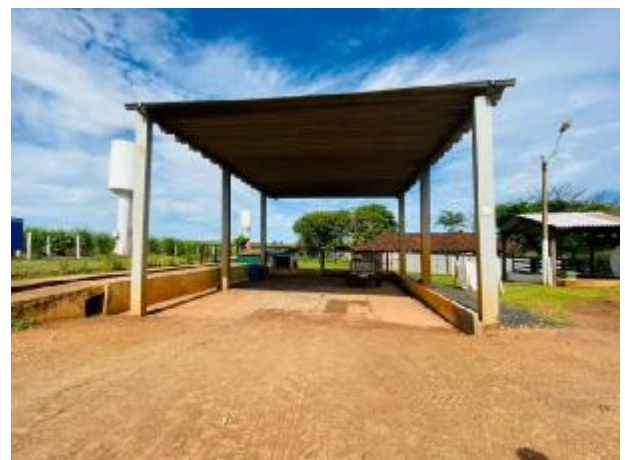
Foto 04. Local para lavagem de maquinário/veículos