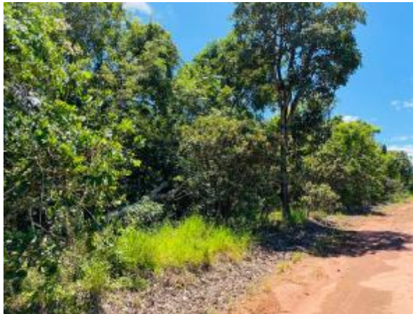
Foto 01. Reserva legal.