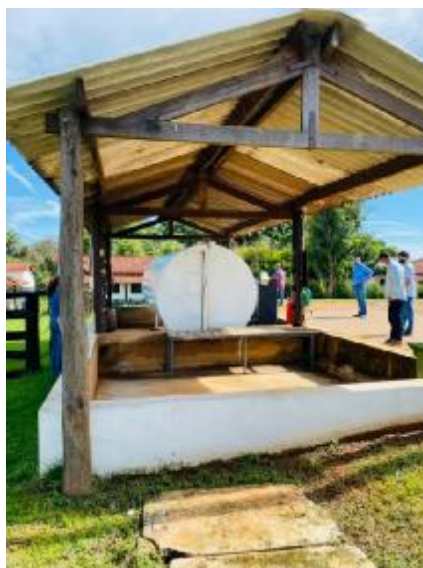
Foto 03. Posto de combustíveis