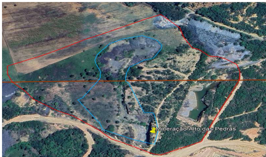
Figura 01 : Azul: ADA. Vermelho: Propriedade. Marron: Limite da ANM.

Conforme imagem satélite (Google Earth) de acordo com as delimitações apresentadas pelo empreendimento nos autos, foi possível visualizar que o local onde o empreendimento será implantado, sendo mais exato, em sua ADA, constam indivíduos arbóreos conforme imagem abaixo.