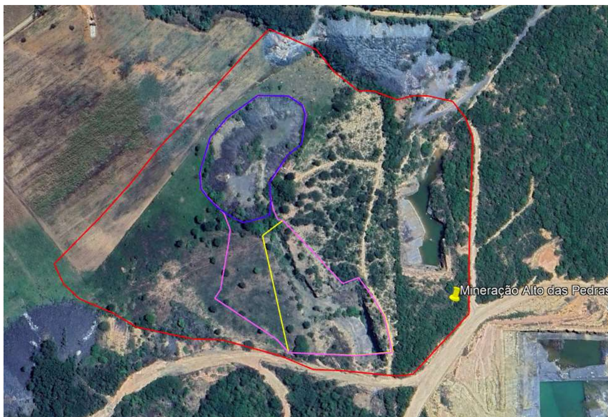
Figura 02: Vermelho: Propriedade. Rosa: ADA. Amarelo: Área de Lavra. Azul: Área de Pilha de Rejeitos. Fonte: RAS

Outro ponto a ser observado no que diz a respeito da vegetação nativa do empreendimento, é quanto a área delimitada para pilha de rejeitos/estéril (1ha). Nesta área é possível verificar alguns indivíduos arbóreos que deverão ser suprimidos para instalação e implantação da pilha de rejeitos. Não foi apresentado autorização para intervenção ambiental desta área do empreendimento.