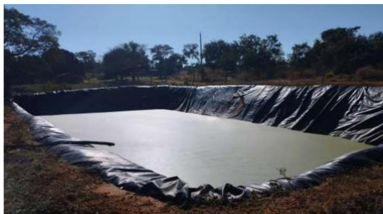
Figura-2. Bacia de decantação dos efluentes líquidos industriais.

A avicultura gera uma grande quantidade de material orgânico, principalmente esterco, que é utilizado no processo de compostagem. O resíduo sólido produzido pelas aves é direcionado para uma área impermeabilizada com concreto e, em seguida, levado para composteiras. O composto resultante é utilizado como adubo natural em empreendimentos vizinhos. O empreendimento possui um desidratador destinado às carcaças das aves mortas (Figura-3), o que permite uma disposição adequada desses resíduos, minimizando potenciais impactos ambientais e de saúde pública.