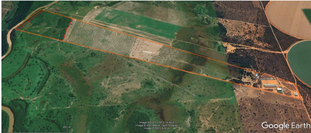
Figura-1. Área e localização do empreendimento.

Engenheira Civil Naiane Batista de Oliveira – CREA-MG MG 226415-D. As áreas de reserva legal do empreendimento estão regularizadas e serão detalhadas no tópico 4.5 desse parecer.