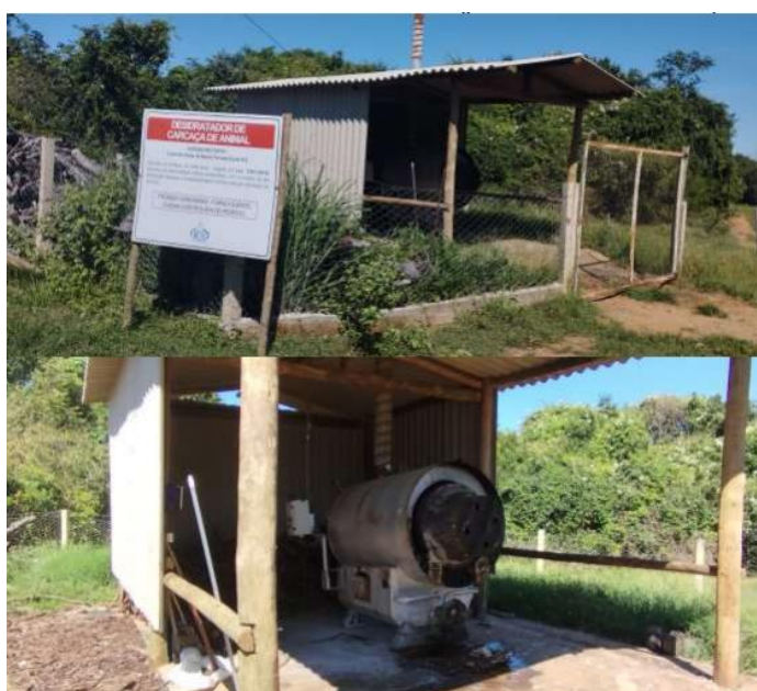
Figura-3. Desidratador de carcaças.