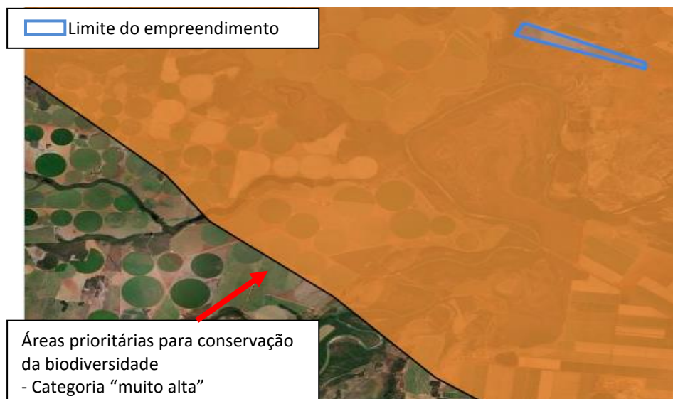
Figura-4. Diagnóstico Ambiental do empreendimento: Área prioritária para conservação da biodiversidade.

A Figura-4 apresenta o diagnóstico ambiental do empreendimento, e demonstra a situação do empreendimento frente à Área prioritária para conservação da biodiversidade.