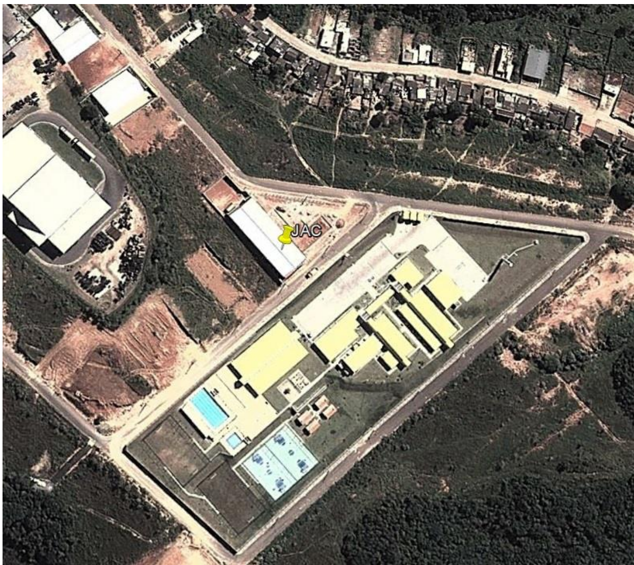
Figura 1: Imagem do Google Earth da localização do empreendimento JAC.

A principal matéria prima utilizada no empreendimento é a farinha de trigo, sendo o consumo médio mensal de 119 toneladas para farinha branca e 146 toneladas para farinha integral.