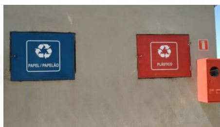
Foto 04. Armazenamento temporário de resíduos sólidos