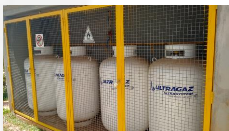
Foto 03. Armazenamento de GLP.