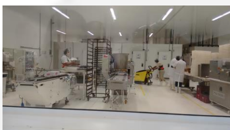
Foto 01. Área de produção.

Empreendedor: JAC Indústria e Comércio de Alimentos Ltda Empreendimento: JAC Indústria e Comércio de Alimentos Ltda CNPJ: 07.874.295/0001-74 Município: Lavras Atividade: Fabricação de produtos alimentares, não especificados ou não classificados Código DN 74/04: D-01-14-7 Processo: 03840/2010/0001/2016 Validade: 04 anos