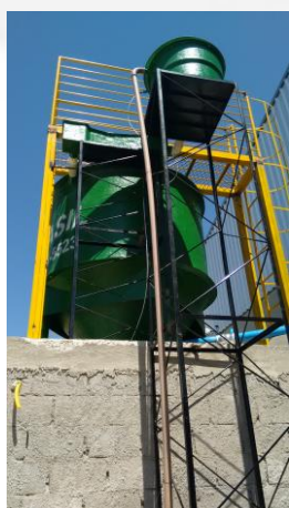
Foto 05. ETE (tratamento físico).