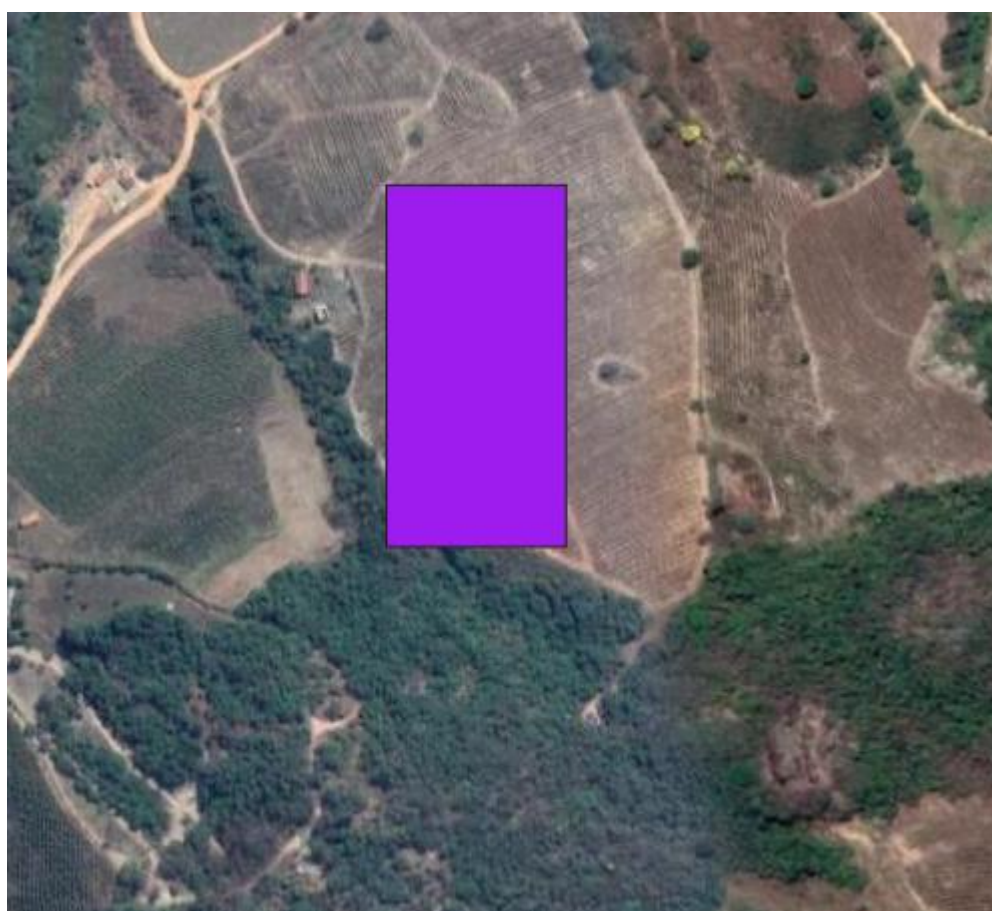
Figura 5 - O polígono do direito minerário sob titularidade do empreendedor, em destaque

Realizando ainda uma análise técnica geoespacial por meio das plataformas da IDE-Sisema e do CAR, identificou-se, ainda, que o CAR apresentado, além de estar cerca de 9 km a leste do polígono informado no SLA/Ecosistemas, também não abrange o polígono do direito minerário cuja titularidade pertence ao empreendedor. Portanto, o CAR apresentado, cujos limites da propriedade podem ser observados na figura a seguir, não possui qualquer relação/coincidência espacial nem com o polígono do empreendimento informado no SLA, nem com o polígono do direito minerário nº 830.497/2021 pertencente ao empreendedor.