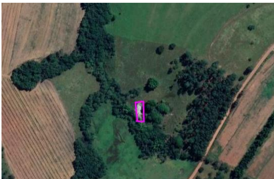
Figura 3 - Polígono de localização do empreendimento conforme apresentado no SLA Já o polígono do direito minerário nº 830.497/2021 (informado no SLA e no RAS), sob titularidade de