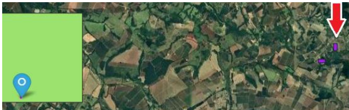
Figura 4 - O marco do empreendimento conforme indicado no SLA, à esquerda da figura, e o polígono do direito minerário sob titularidade do empreendedor, à direita da figura