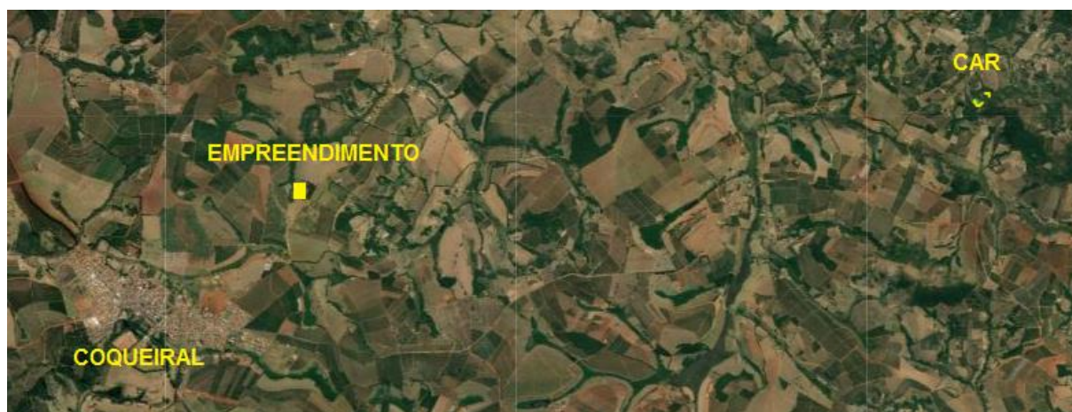
Figura 1 - Localização do empreendimento e do CAR apresentado

Ao se comparar a localização do empreendimento informada no SLA e o CAR da propriedade, identificou-se que se trata de propriedades e localizações distintas, como pode ser constatado nas figuras a seguir.