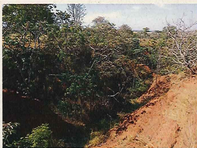
Foto 02. Indivíduos arbóreos dentro da voçoroca.