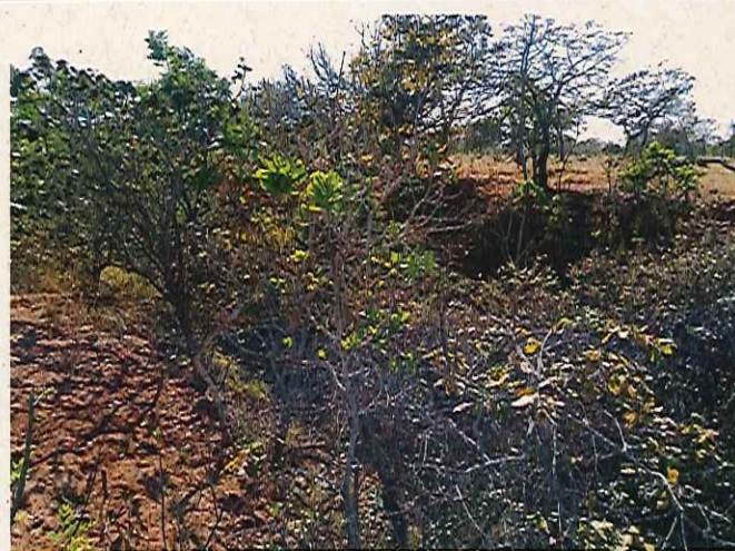
Foto 03. Indivíduos arbóreos dentro e no entorno da voçoroca.