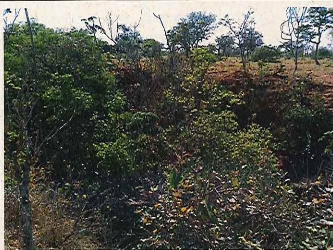
Foto 01. Indivíduos arbóreos dentro da voçoroca.