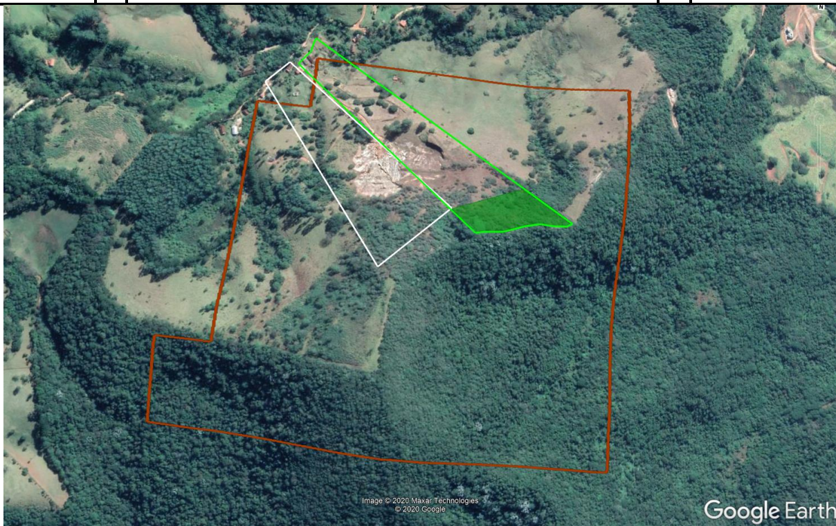
Imagem 2: Em vermelho, poligonal ANM nº 830.237/2005. Em branco, arquivo shp anexado na aba “Atividades” do processo SLA. Em verde, limite da propriedade e sua respectiva reserva legal, conforme declarado no SICAR.

O empreendedor não solicitou neste processo a regularização da atividade de “ Pilhas de rejeito/estéril ”, código A-05-04-5, mas informa no item 4.5 que a disposição de estéril/rejeito ocorre em pilhas. Informa ainda no item 4.4 que a produção de rejeito é de 875m 3 /mês. Assim, consideramos essencial a regularização das pilhas conjuntamente ao processo de lavra, uma vez que, em uma licença com validade de 10 anos, o volume acumulado de rejeito seria de 405.000 m 3 .